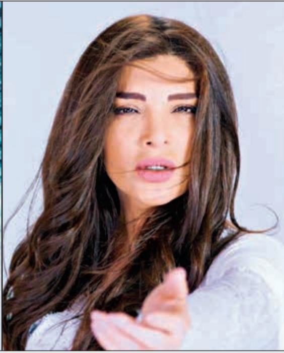
لقطات من كليب «متغرب حبيبي»