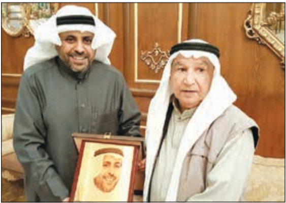
الفنان محمد الخضر يهدي وزير الإعلام والشباب محمد الجبري درعا تذكارية

ثنى الفنان والمخرج محمد الخضر دعم وزير الإعلام ووزير الدولة لشؤون الشباب محمد الجبري لمهرجان الكويت مركز عربي للنص المسرحي والذي تجرى الاستعدادات له على قدم وساق، حيث تنطلق دورته الجديدة في السابع والعشرين من مارس المقبل على خشبة مسرح الفنان القدير الراحل عبدالحسين عبدالرضا.