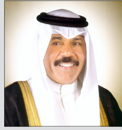
سمو ولي العهد الشيخ نواف الأحمد

صاحب السمو هنا ولي العهد بالذكري الـ 13 لتوليته المنصب: مسيرتكم حافلة بالتفاني المطلق في خدمة وطننا العزيز وشعبنا الكريم 17