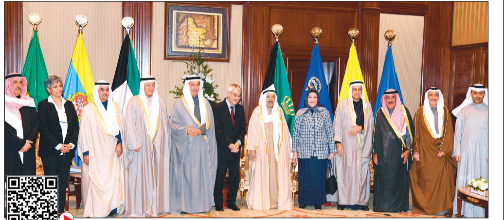
صاحب السمو الأمير الشيخ صباح الأحمد لدى استقباله رئيس وأعضاء مجلس إدارة مؤسسة الكويت للتقدم العلمي