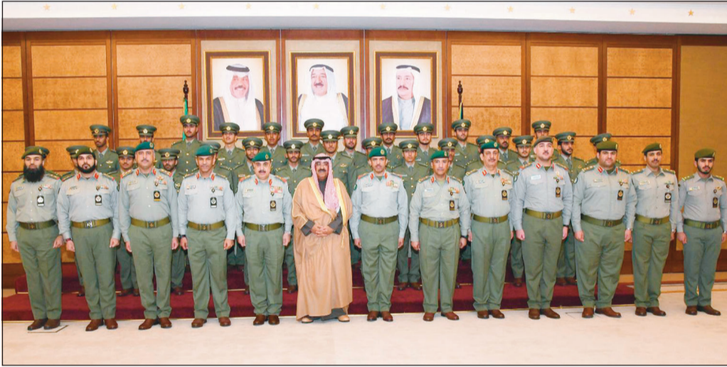
الشيخ مشعل الأحمد والفريق الركن م. هاشم الرفاعي مع الخريجين

أكد نائب رئيس الحرس الوطني الشيخ مشعل الأحمد أهمية تسليح الضباط «بغرس العقيدة الراسخة للدفاع عن قدسية الوطن وأراضيه وتحقيق الأمن والأمان لمواطنيه»، مشيراً إلى أن «التميز في أداء العمل معيار يعتمده الحرس الوطني للمفاضلة بين منتميه»، جاء ذلك خلال استقباله بالرئاسة العامة للحرس الوطني الضباط الخريجين من الدفعة الـ 22 من الطلبة الضباط الجامعيين خريجي كلية علي الصباح العسكرية، والدفعة الـ 14 من كلية أحمد بن محمد العسكرية بدولة قطر الشقيقة. وأوصى الخريجين في كلمة له بالقول: «الوطن.. ثم الوطن.. ثم الوطن.. أمانة في أعناقنا جميعاً»، كما نصحه بالتحلي بقيم ومبادئ الدين الحنيف، «وأن يكونوا الصورة المشرفة للحرس الوطني داخل وخارج أسوار معسكراته».