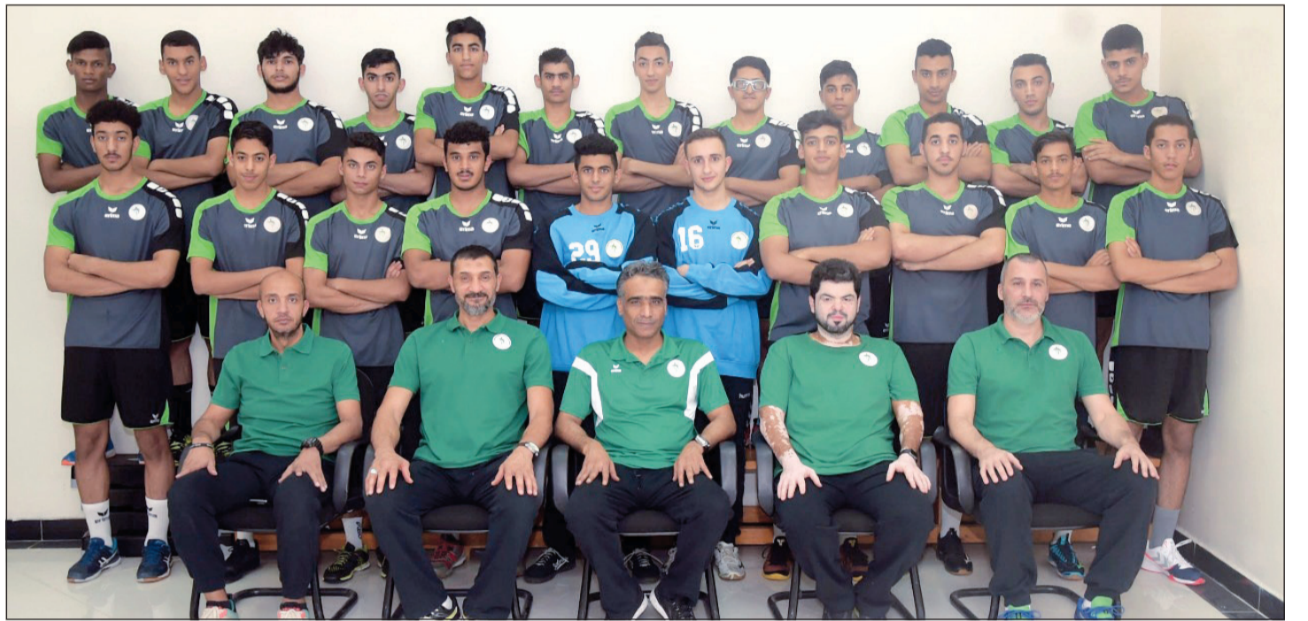
منتخب شباب اليد السعودي