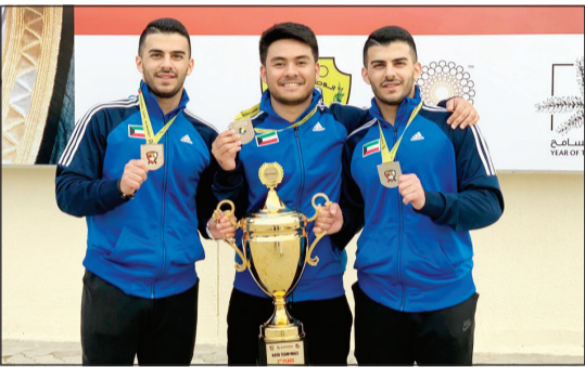
لاعبو منتخب الكويت يحملون كأس المركز الثاني

هنا وزير الاعلام ووزير الدولة لشؤون الشباب الكويتي محمد الجبري منتخب الكويت للرماية بتوجيه بلقب بطولة سمو الأمير الثامنة الكبرى للرماية التي أقيمت مؤخرا بالكويت، مشيدا بالمستوى المتميز الذي ظهر به رماة المنتخب مؤكدا أنهم كانوا على قدر التطلعات في البطولة وأثبتوا جدارتهم في مختلف الاستحقاقات السابقة واعادوا على الظهور المميز في البطولات.