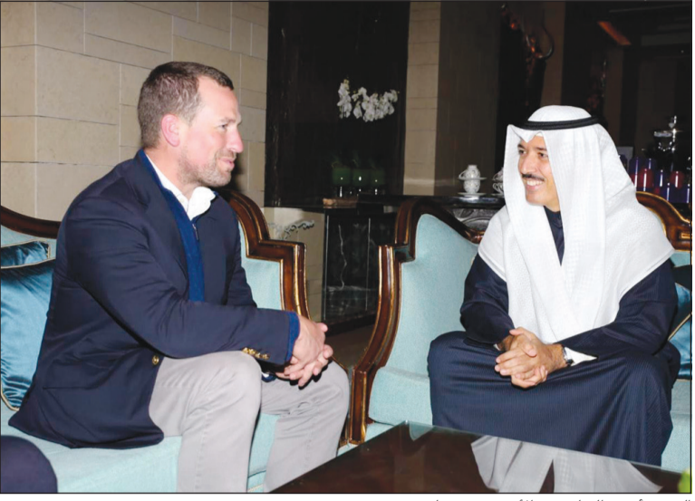
الشيخ أحمد الجابر مع الأمير بيتر فيليب

والأمير فيليب من الشخصيات المهمة بريضة التنس. هذا، وقد اطلع الشيخ أحمد الجابر الأمير بيتر فيليب، خلال اللقاء، على آخر تطورات مجمع الشيخ جابر العبدالله الدولي للتنس وقدم له الدعوة لحضور حفل الافتتاح الكبير للمجمع والذي سيقام في أواخر هذا العام.