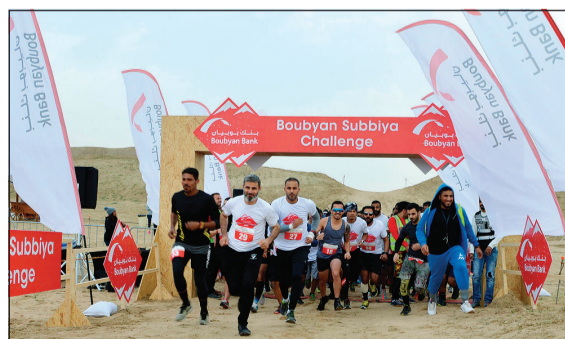
جانب من التحدي

بالإضافة إلى كونه مغامرة فريدة من نوعها إلا أنه دعوة للجميع لاستكشاف الكويت بشكل آخر خاصة ما تحتويه من الكثير من الأماكن الطبيعية الجميلة غير المستغلة من الجميع بالشكل المطلوب. وأضاف «يمكن أن تكون الكويت وجهة خليجية مميزة للفعاليات والأنشطة الرياضية خاصة في فترة الجو المعتدل