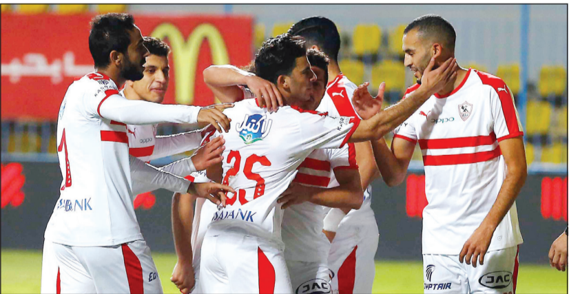
القاهرة - سامي عبد الفتاح

أصبحت الأزمات اليومية هي عنوان الدوري المصري لكرة القدم، وآخر هذه الأزمات، حالة عدم رضا إدارة الأهلي عن الجدولة الجديدة لمباريات الدوري والكأس، والتي ضمت تحديد 28 فبراير الجاري موعدا لمواجهة الأهلي مع بيراميدز في دور الثمانية لكأس مصر، وهو ما سبق أن رفضته إدارة الأهلي ثم أزمة جديدة أثارها إدارة نادي إيني ضد نادي الزمالك بعد الخسارة 1-2 في الجولة 22 من الدوري، بسبب إشراك الزمالك أربعة لاعبين أجنبي في المباراة ومازال الجميع يترقب التطورات في الأزمتين الجديدتين.