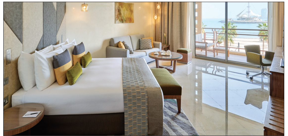
إطلالة مميزة في «مارينا»