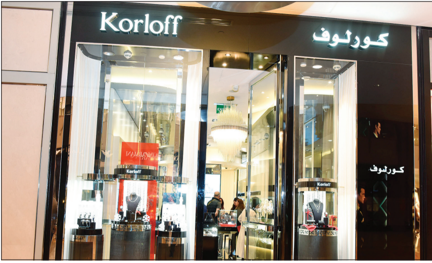
متجر «كورلوف» في مجمع 360