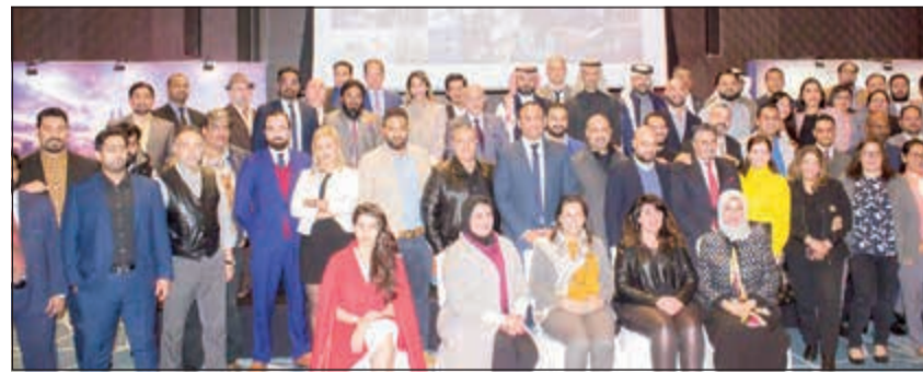
لقطة جماعية للحضور