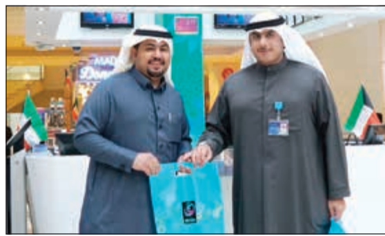
تقديم جائزة لأحد الفائزين خلال الفعالية