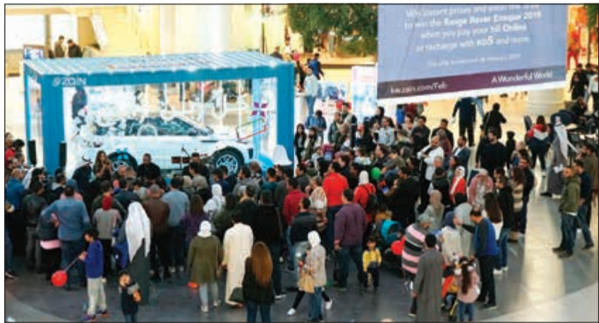
جانب من فعالية كل زين رابح في مارينا مول

احتفلت زين، المزود الرائد للخدمات الرقمية في الكويت، بحملتها التسويقية الجديدة «كل زين رابح» مع عملائها الكرام، وذلك خلال الفعالية التي أقيمت يوم الجمعة 15 فبراير واستمرت على مدار أربع ساعات متواصلة في مارينا مول، والتي استضافت من خلالها الشركة نجوم إذاعة مارينا أف أم وقدمت العديد من الجوائز القيمة للمستمعين والحضور. وأوضحت الشركة في بيان صحفي أن تنظيمها لهذه الفعالية أتى ضمن حملة «كل زين رابح» التي أطلقتها مؤخرا بهدف مشاركة عملائها فرصة وبهجة أعيد الكويت من كل عام، حيث تحرص زين دائما على إطلاق أكبر الحملات التسويقية التي تتجدد بأجمل وأكبر العروض في هذه المناسبة الوطنية الغالية على قلوب الجميع، وذلك لتقديم المجازات الأخرى التي تميزها لعملائها الذين يمثلون أكبر عائلة مشتركة في الكويت.