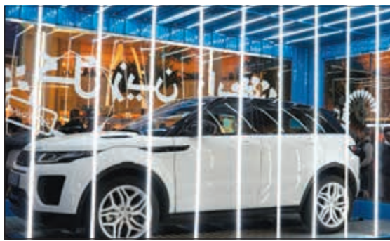
واحدة من خمس سيارات Range Rover Evoque 2019 تقدمها زين كجوائز كبرى في نهاية الحملة

وأكد العيلاني أن تصميم البرنامج التدريبي تم بالتعاون مع مؤسسة يورو موني العالمية بحيث يلبى متطلبات تطوير الخدمات المصرفية المتميزة التي تقدمها إدارة التمويل التجاري إلى قطاعات اقتصادية متنوعة مثل قطاع الاستيراد، المقاولات، أعمال البنى التحتية وغيرها من القطاعات، وهو ما يتطلب وجود موظفين محترفين وعلى درجة عالية من المهنية والكفاءة. وأضاف العيلاني أن بنك الكويت الوطني يحرص دائما على دعم موظفيه بشكل مستمر وتكثيفهم وتأهيلهم عبر طرحة البرامج التدريبية المتخصصة، والمصممة وفق معايير منهجية وعلمية لإعداد الكوادر المهنية المتخصصة، والتي يقدمها نخبة من أفضل خبراء العمل المصرفي الذين يقدمون خبراتهم لموظفي البنك من خلال تلك البرامج.