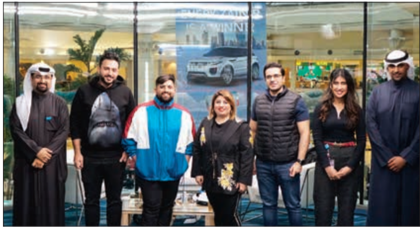
نجوم مارينا أف أم مع مسؤولي زين

الشركة استضافت نجوم إذاعة مارينا أف أم وقدمت العديد من الجوائز