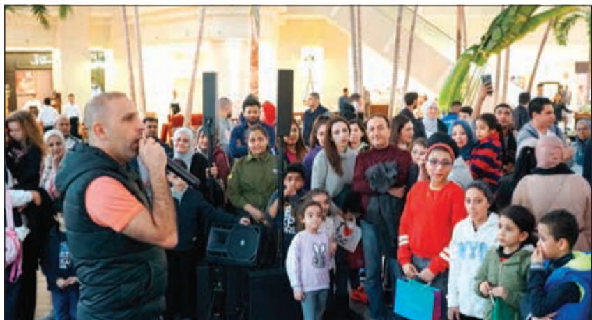
إحدى الفقرات التفاعلية مع الجمهور

في مارينا مول باستعراض سيارة Range Rover Evoque 2019، وهي واحدة من خمس سيارات ستقدمها الشركة كجوائز كبرى لخمس رابحين محظوظين خلال السحب النهائي ضمن حملة «كل زين رابح»، والتي تستمر حتى يوم الخميس 28 فبراير الجاري، وتقدم جوائز فورية قيمة لجميع العملاء من ذوي الدفع الأجل والمسبق طوال فترة الحملة.