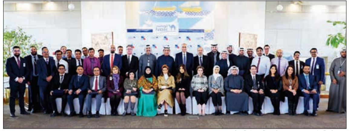
مسؤولو البنك مع خريجي برنامج «التمويل التجاري»

أقام بنك الكويت الوطني حفل تكريم لموظفيه الذين أنهوا البرنامج التدريبي المتخصص في مجال «التمويل التجاري»، والذي يقدمه البنك لموظفيه بالتعاون مع مؤسسة يورو موني العالمية المتخصصة بالتدريب في هذا المجال. وشهد الحفل حضور قياديين من البنك الذين قاموا بتكريم الموظفين، وفي مقدمتهم الرئيس التنفيذي لبنك الكويت الوطني - الكويت صلاح يوسف الفليج، ومدير عام الموارد البشرية مجموعة بنك الكويت الوطني من تقديم البرنامج التدريبي المتخصص في مجال «التمويل التجاري» لموظفيه إلى تطوير مهاراتهم في مجال إدارة التمويل التجاري وإطلاعهم على أحدث التقنيات والأساليب المهنية بما يسهم في خلق كوادر مصرفية تواكب أفضل المعايير والممارسات العالمية.