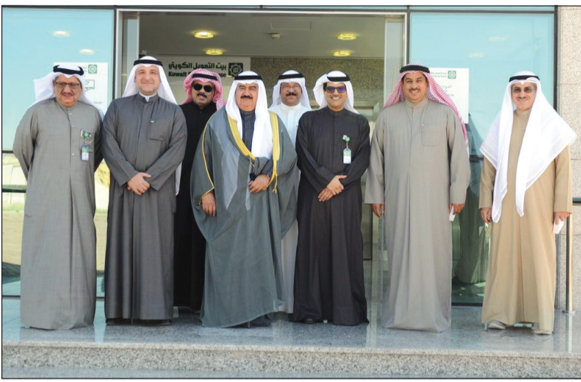
صورة تذكارية من أمام الفرع الجديد

ونوه الناهض بحرص «بيتك» على الاستثمار في تقديم أفضل الخدمات لعملائه والتجاوب مع تطلعاتهم، وتلبية طموحاتهم، والارتقاء بمستوى الخدمة وتحقيق أفضل معدلات الأداء بأعلى معايير الدقة والسرعة والأمان، لافتاً إلى أن الفرع تشكل أداة تواصل فعالة مع العملاء، وناقدًا مهمة لتسويق الخدمات والمنتجات المتعددة التي ي طرحها البنك.