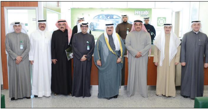
المهنا والناهض وجولة على أقسام الفرع