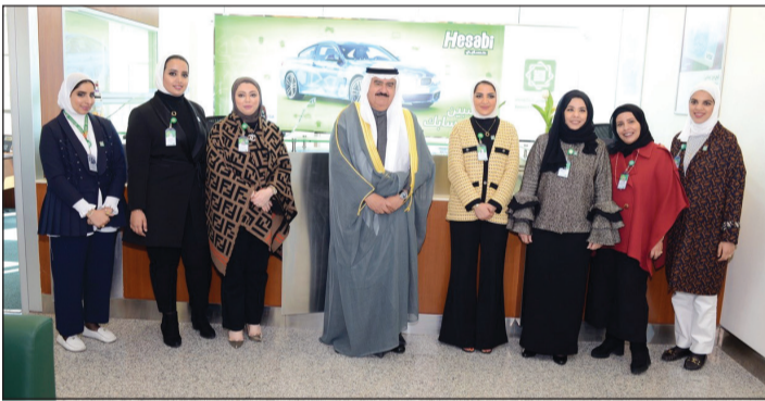
وجولة على فرع السيدات

والجدير بالذكر أن الفخامة والراحة تتميز بهما سيارات جينيسيس إلى جانب ما تتسم به من الكفاءة العالية والاعتمادية الطويلة والأداء القوي إلى جانب التصميم الخلاق، فضلاً عن المواصفات الخاصة التي تمنحك مجالاً واسعاً لاختيار ما يناسب حاجتك وميزانيتك وأولوياتك لدى زيارتك فرع جينيسيس، ليقدّم لك موظفوننا الأكفاء نصيحة قيمة عن الطراز التي يلائمك ويحببها لك، وتعليقاً على هذا العرض المذهل، قال المتحدث عن قسم المبيعات في شركة «شمال