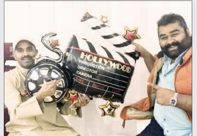
بطل الفيلم النجم طارق العلي والمخرج رمضان خسروه في بداية تصوير الفيلم