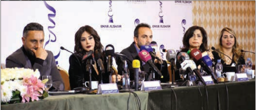
جانب من مؤتمر مسلسل «مسافة أمان»