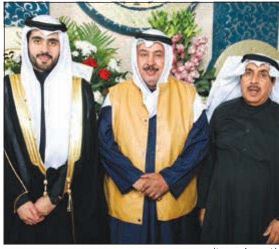
خلف دميشير مهنتا