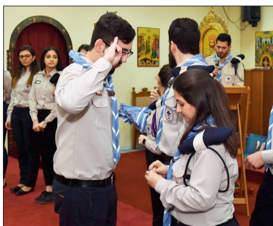
أداء الجوال ايلي بنوت عهد الكشاف