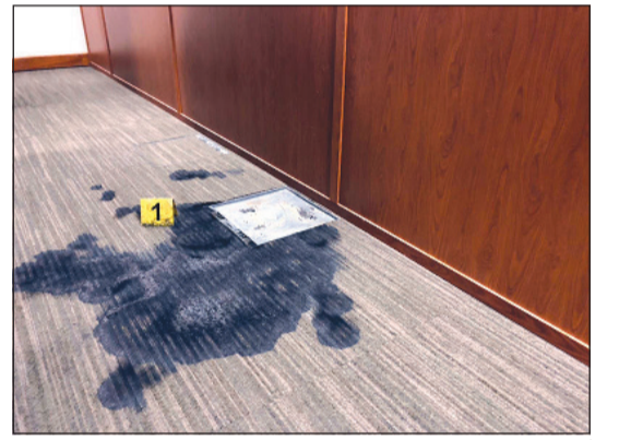
آثار حريق منطقة حولي التعليمية