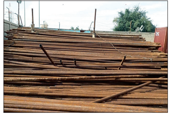
الحديد الذي سقط فوق الوافد