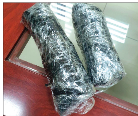
مخدر الشبو بعد استخراجه من الشاحنة

كثافة في الثلاجة المرفقة بالشاحنة وتحديدًا خلف الثلاجة وبطريقة فنية يصعب اكتشافها بالعين المجردة. وأضاف البركة: جرى إجراء تفتيش يدوي وتفكيك الأجزاء المشتبه بها من قبل المفتشين في منفذ العبدلي تحت إشراف رجال إدارة التحري والعثور على المخدر، مشيراً إلى انه جار اتخاذ جميع الاجراءات القانونية وإخطار الأجهزة المختصة لتسليم المتهم العربي والمضبوطات.