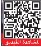
من المقطع المتداول لتجاوز المركبة للسيارات وكسر الإشارة الحمراء

لارتكاب هذا التصرف الذي أثار استغراب لرواد مواقع التواصل الاجتماعي.