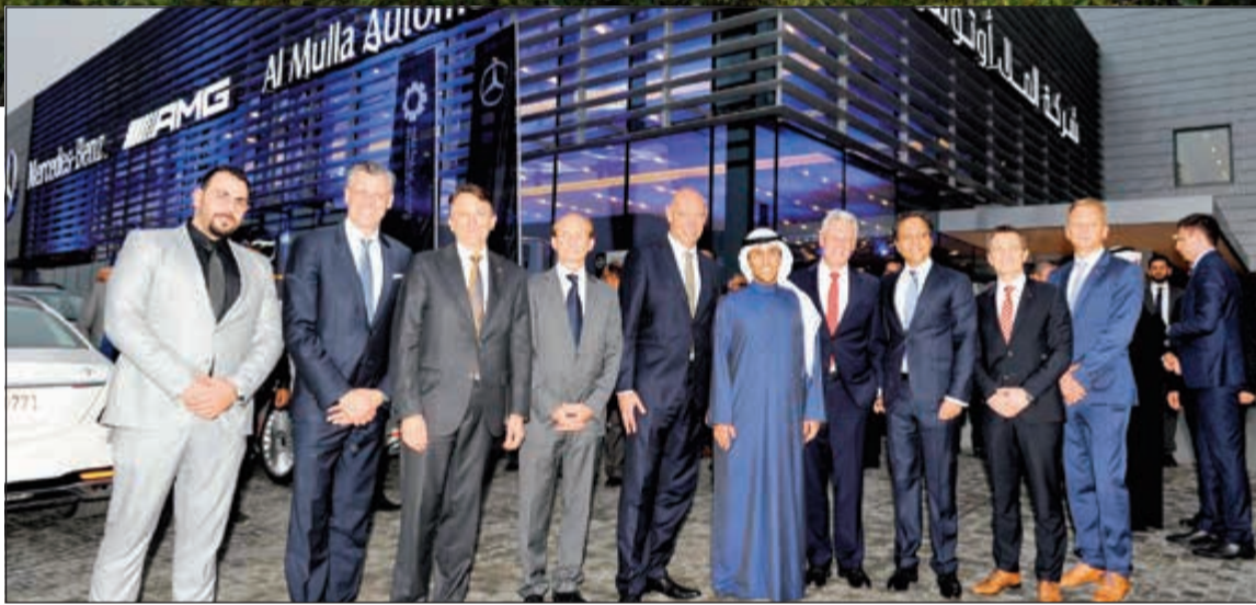
لقطة تذكارية أمام المعرض الجديد