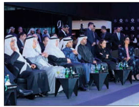
مجلس إدارة مجموعة الملا