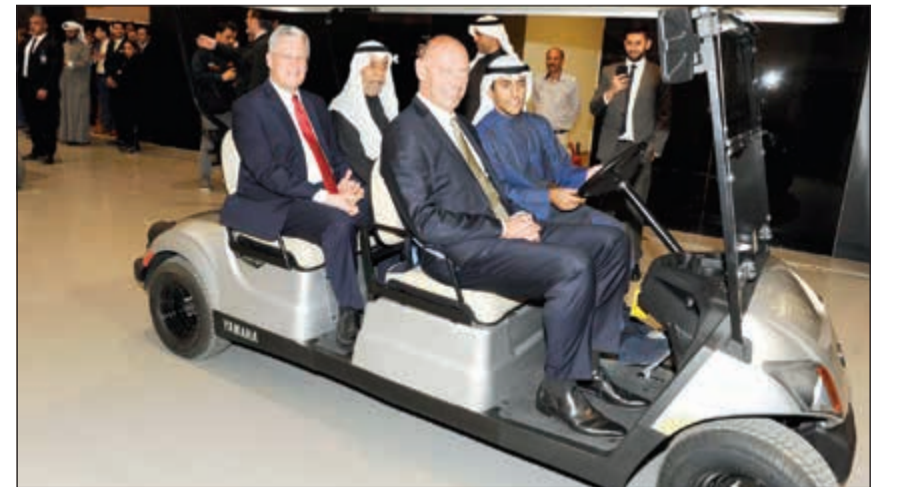
جولة في المعرض الجديد