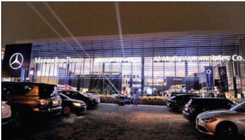
صالة عرض «مرسيدس- بنز» الكويت

هايس: ملتزمون بتقديم تجربة جديدة ومميزة لعملائنا في الكويت باستخدام التكنولوجيا الرقمية الحديثة