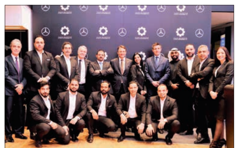
فريق عمل المعرض