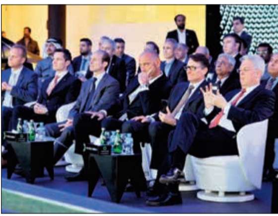
السفير الألماني وكبار ممثلي مرسيدس - بنز للسيارات في الشرق الأوسط

ويعمل في صالة العرض فريق من الخبراء المستعدين للإجابة عن جميع الاستفسارات وتقديم النصائح العملية عن كيفية استخدام مميزات السيارة. وتوفر صالة عرض مرسيدس- بنز الكويت تجربة استثنائية لضيوفها وعملاتها منذ لحظة دخولهم صالة العرض إلى تسلم سيارة مرسيدس- بنز الجديدة، وتتضمن ركناً خاصاً بعرض سيارات AMG عالية الأداء. ويعتبر المرفق متجراً شاملاً، فهو يوفر مبيعات السيارات والخدمات المتكاملة بعد البيع. وتهدف شركة الملا أوتوموبيلز إلى توفير شبكة واسعة من المرافق ومجموعة متنوعة من الخدمات الجديدة لعملائها في المستقبل القريب، مع ضمان تقديم أفضل الخدمات والالتزام بمعايير الجودة