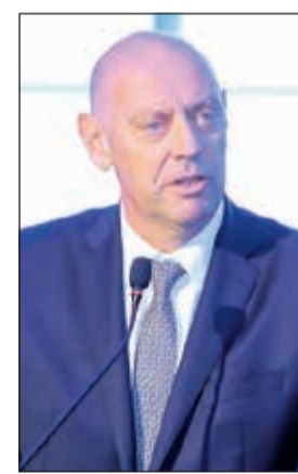
مارك دي هايس متحدثاً