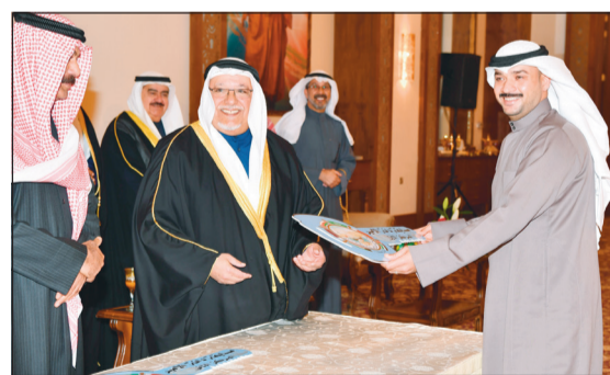
جائزة المركز الأول بمسابقة داتة الأمير

حيث ان لهم دوراً فعالاً ونستمد منهم النصائح والرشد في إنجاح هذا الموروث حيث شارك الجميع في هذه المسابقات بين الريعيل الأول والجيل الحالي من الشباب المحب للتراث البحري. وقيل الختام، لا بد أن نشكر الجهات الحكومية التي تساهم معنا سنوياً في إنجاح مسابقات وأنشطة المهرجان لمدة تسع سنوات على التوالي والتي منها وزارة الداخلية ممثلة في خفر السواحل ووزارة الصحة ممثلة في الطوارئ الطبية ولا ننسى الدور المميز لوزارة الإعلام التي كان لها الدور الإيجابي في بث ونشر هذه الفعاليات والمسابقات من خلال الإذاعة والتلفزيون والصحف اليومية ووسائل المحب للتراث البحري. ولا يسعنا في الختام إلا أن نرفع بقلوبنا صاحب السمو الأمير الشيخ صباح الأحمد ومقام سمو ولي عهده الأمين والشكر والامتنان على دعمهما اللامحدود لأبنائهم العاملين في مهرجان الموروث البحري الخليجي في موسمه 2018 - المناسبة.