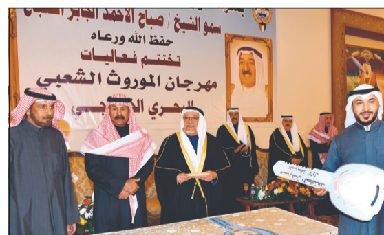
جائزة المركز الأول بمسابقة الجند