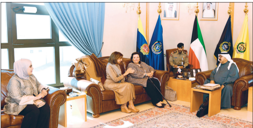
الشيخ ناصر صباح الأحمد مستقبلاً عدداً من ملاك المدارس الخاصة

وأشار البيان الى انه تم بحث دور البنك الدولي في الحركة الاقتصادية والمشاركة في جهود التنمية المستقبلية، وذلك انطلاقاً من رؤية الكويت الجديدة 2035 لصاحب السمو الأمير القائد الأعلى للقوات المسلحة الشيخ صباح الأحمد. حضر اللقاء وكيل وزارة الدفاع الشيخ أحمد المنصور. إلى ذلك، استقبل النائب الأول لرئيس مجلس الوزراء ووزير الدفاع الشيخ ناصر صباح الأحمد بمكتبه صباح أمس عدداً من ملاك المدارس الخاصة بالكويت.