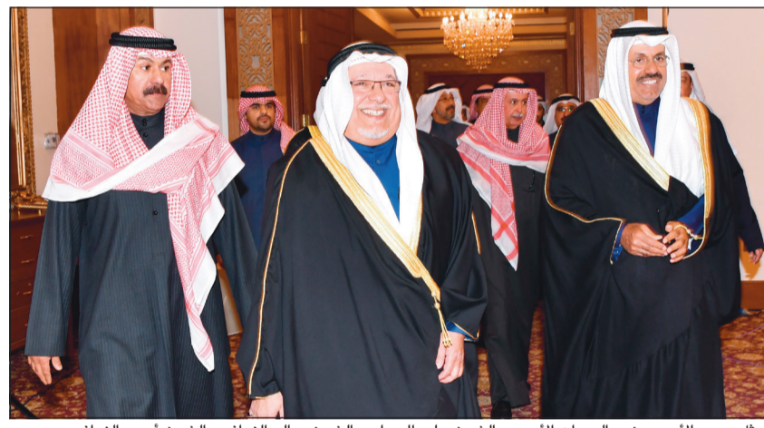
ممثل سمو الأمير وزير الديوان الأميري الشيخ علي الجراح والشيخ سالم النواف والشيخ أحمد النواف

تحت رعاية صاحب السمو الأمير الشيخ صباح الأحمد أقيم مساء أمس الأول الحفل الختامي لفعاليات (مهرجان الموروث البحري الخليجي) بدورته التاسعة. وقد اناب سموه وزير شؤون الديوان الأميري الشيخ علي الجراح لحضور الحفل. هذا، وقد وصل ممثل سموه إلى مكان الحفل وكان في استقباله رئيس اللجنة المنظمة لمهرجان الموروث البحري الخليجي الشيخ سالم النواف. ثم ألقى رئيس اللجنة المنظمة لمهرجان الموروث البحري الخليجي كلمة جاء فيها: إنه لشرف عظيم أن يحظى مهرجان الموروث البحري الخليجي بهذه الرعاية السامية الكريمة من مقام صاحب السمو الأمير الشيخ صباح الأحمد وسمو ولي عهده الأمين الشيخ نواف الأحمد لسمعة التاسعة على التوالي. فهذه الرعاية والمكرمة الأميرة هي التبراس الذي نسير عليه في المحافظة على الموروث البحري الذي يمثل تراث الأباء والأجداد وهو الدافع الحقيقي للمقاومين على هذا الموروث البحري الذين سعوا جاهدين للمحافظة عليه من خلال التنوع في المسابقات والأنشطة والفعاليات البحرية لإتاحة المجال لأكثر عدد ممكن من الحداثة والمهتمين بالتراث البحري للمشاركة في هذه المسابقات التي حرصت اللجنة المنظمة على تنوعها ما بين مسابقة الحداثة ومسابقة الجند ومسابقة حداق السيف والمسابقة الكبرى (مسابقة داتة الأمير). وهذا العام تميزت فعالياتنا بزيادة واضحة وملحوظة لقيمة الجوائز للفائزين والتي كان لها الأثر الطيب في نفوس المشاركين جميعاً. ولن ننسى الريعيل الأول