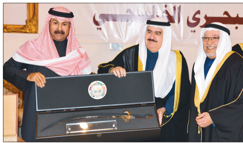
الشيخ علي الجراح والشيخ سالم النواف والفريق ثابت المنها وهديّة تذكارية بالمناسبة

تحت رعاية صاحب السمو الأمير الشيخ صباح الأحمد أقيم مساء أمس الأول الحفل الختامي لفعاليات (مهرجان الموروث البحري الخليجي) بدورته التاسعة. وقد اناب سموه وزير شؤون الديوان الأميري الشيخ علي الجراح لحضور الحفل. هذا، وقد وصل ممثل سموه إلى مكان الحفل وكان في استقباله رئيس اللجنة المنظمة لمهرجان الموروث البحري الخليجي الشيخ سالم النواف. ثم ألقى رئيس اللجنة المنظمة لمهرجان الموروث البحري الخليجي كلمة جاء فيها: إنه لشرف عظيم أن يحظى مهرجان الموروث البحري الخليجي بهذه الرعاية السامية الكريمة من مقام صاحب السمو الأمير الشيخ صباح الأحمد وسمو ولي عهده الأمين الشيخ نواف الأحمد لسمعة التاسعة على التوالي. فهذه الرعاية والمكرمة الأميرة هي التبراس الذي نسير عليه في المحافظة على الموروث البحري الذي يمثل تراث الأباء والأجداد وهو الدافع الحقيقي للمقاومين على هذا الموروث البحري الذين سعوا جاهدين للمحافظة عليه من خلال التنوع في المسابقات والأنشطة والفعاليات البحرية لإتاحة المجال لأكثر عدد ممكن من الحداثة والمهتمين بالتراث البحري للمشاركة في هذه المسابقات التي حرصت اللجنة المنظمة على تنوعها ما بين مسابقة الحداثة ومسابقة الجند ومسابقة حداق السيف والمسابقة الكبرى (مسابقة داتة الأمير). وهذا العام تميزت فعالياتنا بزيادة واضحة وملحوظة لقيمة الجوائز للفائزين والتي كان لها الأثر الطيب في نفوس المشاركين جميعاً. ولن ننسى الريعيل الأول