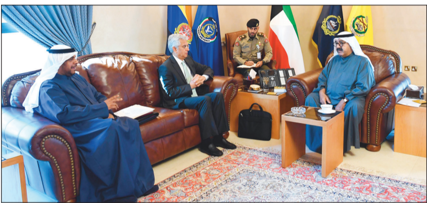
الشيخ ناصر صباح الأحمد مستقبلاً مدير البنك الدولي ديميرزا حسن

اجتمع النائب الأول لرئيس مجلس الوزراء ووزير الدفاع الشيخ ناصر صباح الأحمد بمكتبه أمس الثلاثاء مع المدير التنفيذي وعميد مجلس المديرين التنفيذيين لدى البنك الدولي ديميرزا حسن. وقالت وزارة الدفاع في بيان صحافي إن اللقاء ناقش أهم الأمور والمواضيع ذات الاهتمام المشترك، لاسيما المتعلقة بالجوانب الاقتصادية وسبل التعاون بين الكويت والبنك الدولي.