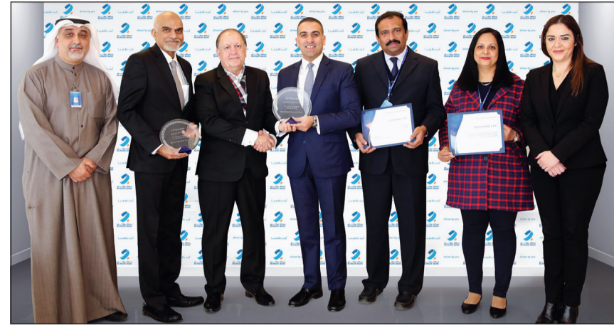
ممثلو بنك برقان خلال تسليمهم الجائزة

أعلن بنك برقان مؤخراً حصوله على جائزة «النخبة للتميز بالجودة» المرموقة لعام 2018 من «جيه بي مورغان تشيس»، تأتي هذه الجائزة تقديراً لأدائه، كما تسلط الجائزة الضوء على المعايير المتقدمة للبنك في الحفاظ على المستوى المتميز للخدمات والعمليات التي تقدمها على مدار العام في مجال تحويل المحافظ بالدولار الأميركي، التي تعكس التزام الموظفين المسؤولين عن مثل هذه العمليات بمعايير رفيعة الجودة.