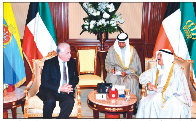
صاحب السمو الأمير الشيخ صباح الأحمد مستقبلاً محافظ جنوب سيناء اللواء خالد فودة

استقبل صاحب السمو الأمير الشيخ صباح الأحمد بقصر بيان صباح أمس رئيس مجلس الأمة مرزوق علي الغانم. كما استقبل سموه بقصر بيان صباح أمس وزير الدولة للشؤون الاقتصادية مريم العقيل، ورئيسي المجلس الاستشاري لمرکز بان كي مون للمواطنة العالمية، معالي الأمين العام السابق للأمم المتحدة بان كي مون، ورئيس جمهورية النمسا السابق د.هاينز فيشر، وذلك بمناسبة انعقاد الاجتماع الثالث للمجلس الاستشاري لمرکز بان كي مون للمواطنة العالمية والمشاركة بمنتهى تكريم المرأة وتعزيز دور الشباب في التنمية والمواطنة والمقام في الكويت. كما استقبل سموه بقصر بيان صباح أمس محافظ جنوب سيناء بجمهورية مصر العربية الشقيقة اللواء خالد فودة، وذلك بمناسبة زيارته للبلاد. حضر المقابلة وزير شؤون الديوان الأميري الشيخ علي الجراح ومحافظ الفروانية الشيخ فيصل الحمود. كما استقبل سموه بقصر بيان صباح أمس شيما يوسف الشقيقة اللواء خالد فودة، وذلك بمناسبة زيارته للبلاد. حضر المقابلة وزير شؤون الديوان الأميري الشيخ علي الجراح ومحافظ الفروانية الشيخ فيصل الحمود. كما استقبل سموه بقصر بيان صباح أمس شيما يوسف الشقيقة اللواء خالد فودة، وذلك بمناسبة زيارته للبلاد. حضر المقابلة وزير شؤون الديوان الأميري الشيخ علي الجراح ومحافظ الفروانية الشيخ فيصل الحمود. كما استقبل سموه بقصر بيان صباح أمس شيما يوسف الشقيقة اللواء خالد فودة، وذلك بمناسبة زيارته للبلاد. حضر المقابلة وزير شؤون الديوان الأميري الشيخ علي الجراح ومحافظ الفروانية الشيخ فيصل الحمود.