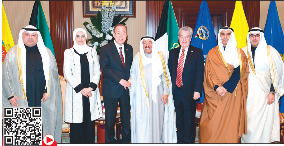
صاحب السمو الأمير الشيخ صباح الأحمد مستقبلاً مريم العقيل وبان كي مون ود.هاينز فيشر