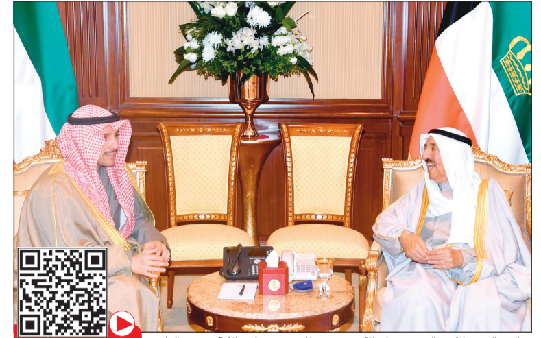
صاحب السمو الأمير الشيخ صباح الأحمد مستقبلاً رئيس مجلس الأمة مرزوق الغانم