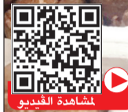
الفقع سيد الموائد في فصل الشتاء

وفي مقدمتهم الكويتيون لقرب المدينة من الكويت وكونه ممرا لطريرتهم في وجهاتهم للتحزّه في الصحراء السعودية في مناطق الصمان والشمال والموارد بالسوق من المحطات الأساسية. وذكر عدد من رواد السوق الذي يبدأ بيع الفقع فيه مع ساعات الصباح الأولى ويكون الفقع طازجا وحديث «للطق»، أن الأسعار تختلف من يوم لآخر وتتباين وفق نوعية المعروض ومناطق جلبه، حيث تتراوح الأسعار بين 10 و20 دينارا للكيلو وتعود كذلك الى أنواعه حيث يعتبر فقع «إرجاوي» هو الأعلى ويكون لونه ناصع البياض وذا رائحة نفاذة ويعتبر من أفضر وأغلى أنواع الفقع ويأتي بعده «أخلاسي» ويمتاز باللون البني الداكن ويعد من الأنواع المرغوبة لكون أسعاره متوسطة ومناسبة نسبيا ويتوافر بكميات أكثر.