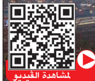
انهيار الجسر حصل أثناء خضوعه لعمليات صيانة

أ.ف.ب: تواصل سلطات مدينة جنوى الإيطالية عملية هدم بقايا جسر موراندي الذي انهيار في أغسطس الماضي وخلف أكثر من 40 قتيلًا. وتقدر السلطات في المدينة تكاليف الهدم ورفع الانقاض بـ19 مليون يورو. وكان 200 متر من جسر موراندي المعلق في منطقة صناعية في غرب جنوى قد انهيار بسبب الأمطار الغزيرة المصاحبة لعاصفة حينها. وأفاد شهود عيان بأن الجسر قد ضرب بصاعقة قبل انهياره، فيما كان عدد المركبات التي بلغ عن سقوطها من الجسر كان بين 30 و35 مركبة.