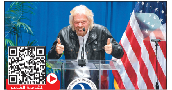
ريتشارد برانسون متحدثا خلال حفل التكريم

أ.ف.ب: قال الملياردير البريطاني ريتشارد برانسون، إنه يخطط للسفر إلى الفضاء خلال الأشهر الـ5 المقبلة في مركبته الفضائية الخاصة «فيرجين غالاكتيك». وأضاف رئيس مجموعة «فيرجين» على هامش حفلة تكريم «فيرجين غالاكتيك» في متحف الفضاء في واشنطن: «أمنيتي أن أذهب إلى الفضاء في مناسبة الذكرى الخمسين لهبوط الإنسان على سطح القمر، وهذا ما نعمل عليه».