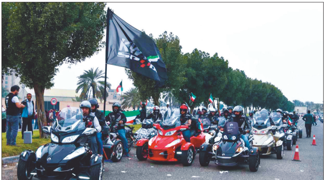
جانب من مسيرة الدراجات النارية (رايد في حب الكويت)

ليحتضن العديد من عشاق الدراجات النارية من الكويت وخارجها بمشاركة فريق «كويت دراجون». وأضاف النجادي أن هذا الكرنفال هو الأكبر من نوعه على مستوى الشرق الأوسط لجمال الدراجات النارية إذ تتنافس فيه أكثر من 100 دراجة للفوز بجوائز مسابقة «الشو»، مثل هذه المسابقات، موضحا أن الحكام سيختارون مشاركا واحدا للفوز بمسابقة الجمال وتمثيل العرب.