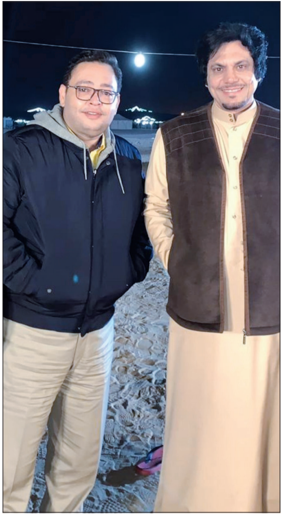
الراشد مع الفنان أحمد رزق في موقع التصوير في أحد المخيمات