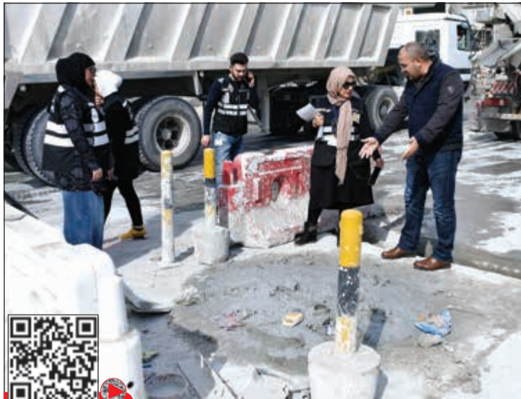
رصد إحدى المخالفات