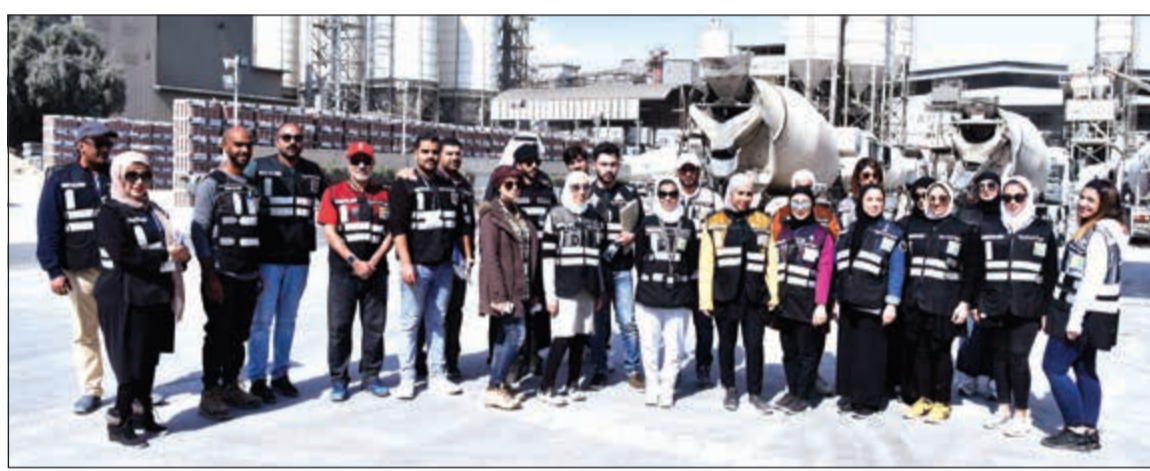
عدد من المشاركين في الجولة التفتيشية بمنظمة مصانع الشعبية

ولفت الإبراهيم إلى أن العقوبات المترتبة على المخالفات متنوعة ولكنها لا تقل عن 5 آلاف دينار إلى أن تصل في بعض الأحوال إلى 20 ألفاً، مبيناً أن مثل هذه الجزاءات يجب أن تكون كفيلاً بردع مثل هذه المخالفات حيث إن تكرار المخالفة يضاعف قيمة الغرامة وتصل إلى أن ترأسل الهيئة العامة للصناعة لإيقاف نشاط المصنع المخالف. وطالب الإبراهيم بضرورة الالتزام بقانون حماية البيئة وهو قانون تم تطبيقه منذ العام 2014 فلا بد أن يكون لدى هذه المصانع الوعي والثقافة البيئية ولهم ولعمال المنشأة.