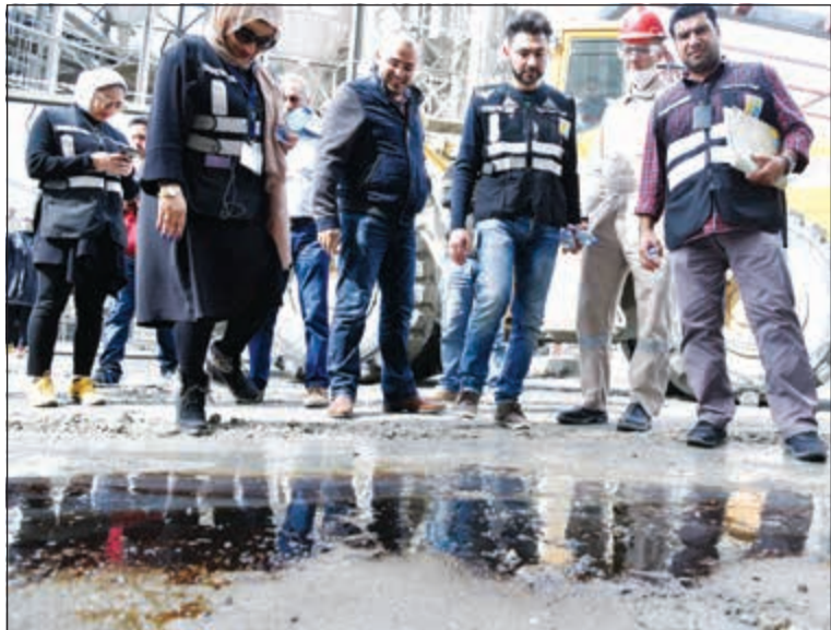
ومخالفة أخرى جسيمة