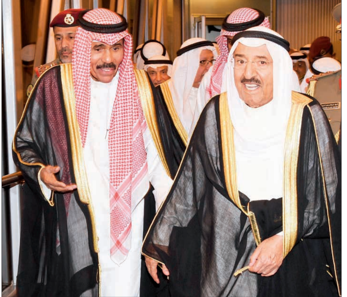
صاحب السمو الأمير الشيخ صباح الأحمد مع سمو ولي العهد الشيخ نواف الأحمد