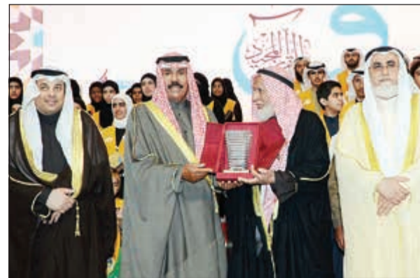
سمو ولي العهد مكرماً حمود الرومي خلال حفل تكريم الفائزين بمسابقة الكويت لحفظ القرآن الكريم