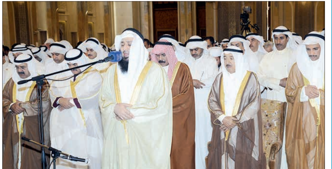
صاحب السمو الأمير الشيخ صباح الأحمد وسمو ولي العهد خلال الصلاة الموحدة بين السنة والشيعية في المسجد الكبير بعد حادثة التفجير الإرهابي لمسجد الصادق