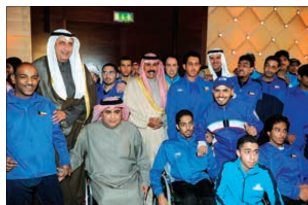
سموه يتوسط لاعبي نادي المعاقين خلال رعايته حفل الهيئة العامة للشباب والرياضة لتكريم اللاعبين المعزولين