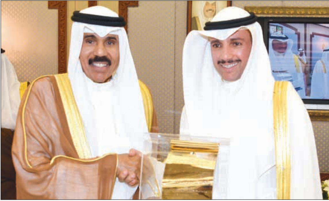
سموه مع رئيس مجلس الامة مرزوق الغانم قبيل افتتاح دور الانعقاد