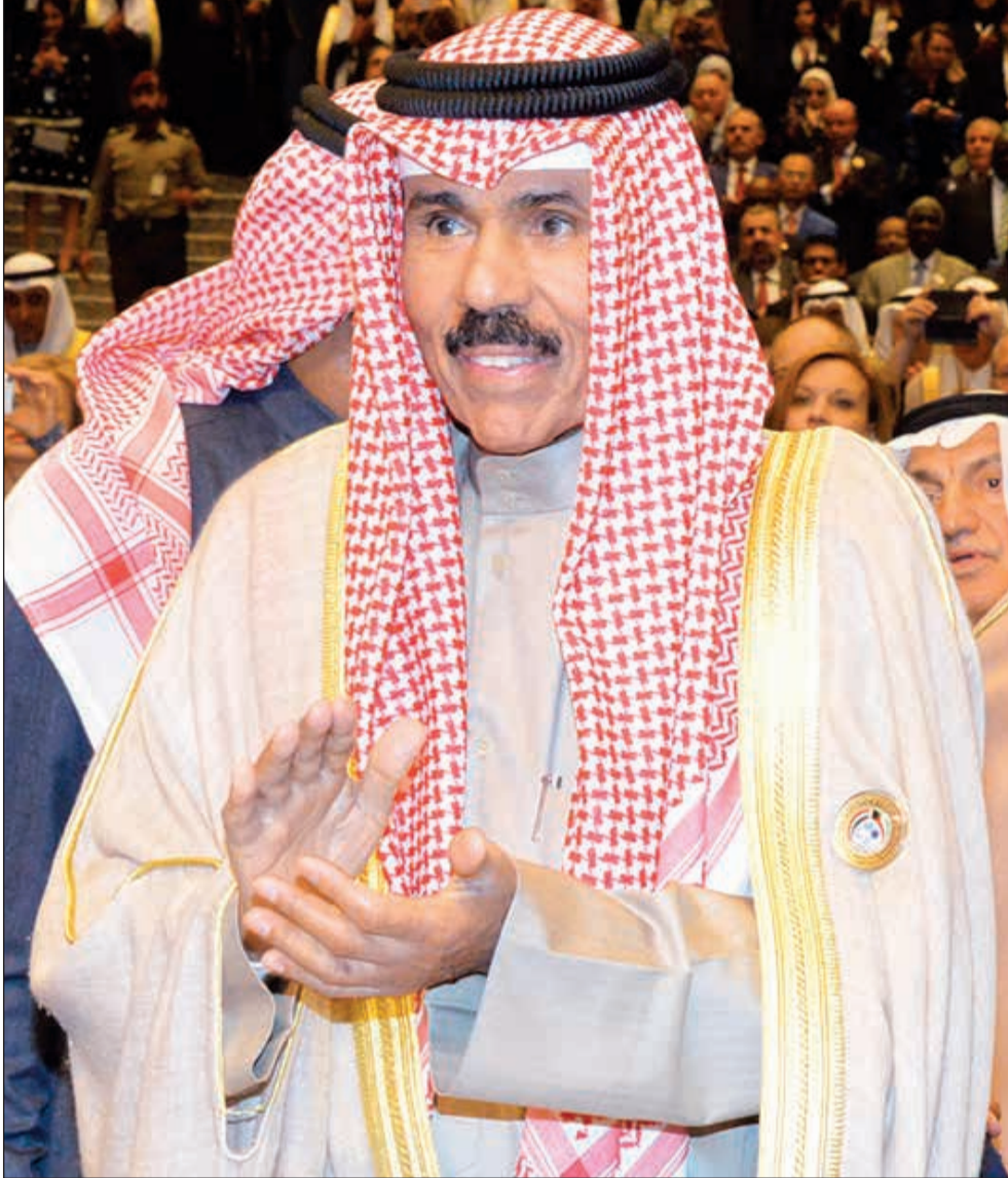
سمو ولي العهد خير عزيد لسمو الأمير