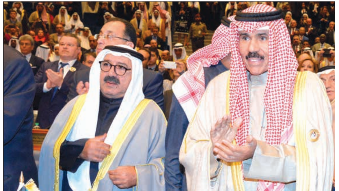
..وسموه مع النائب الأول لرئيس مجلس الوزراء ووزير الدفاع الشيخ ناصر صباح الأحمد