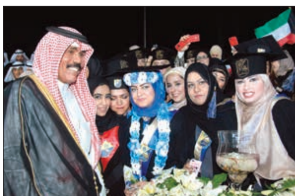
..وسموه مع عدد من الخريجات خلال حفل التخرج السنوي الموحد لخريجي جامعة الكويت