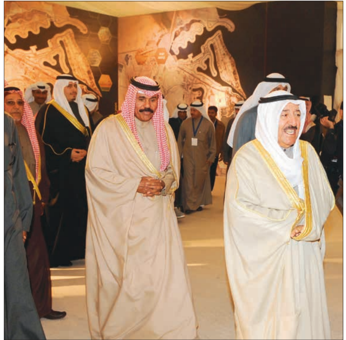
صاحب السمو الأمير الشيخ صباح الأحمد وسمو ولي العهد الشيخ نواف الأحمد خلال افتتاح مشروع مدينة صباح الأحمد البحرية