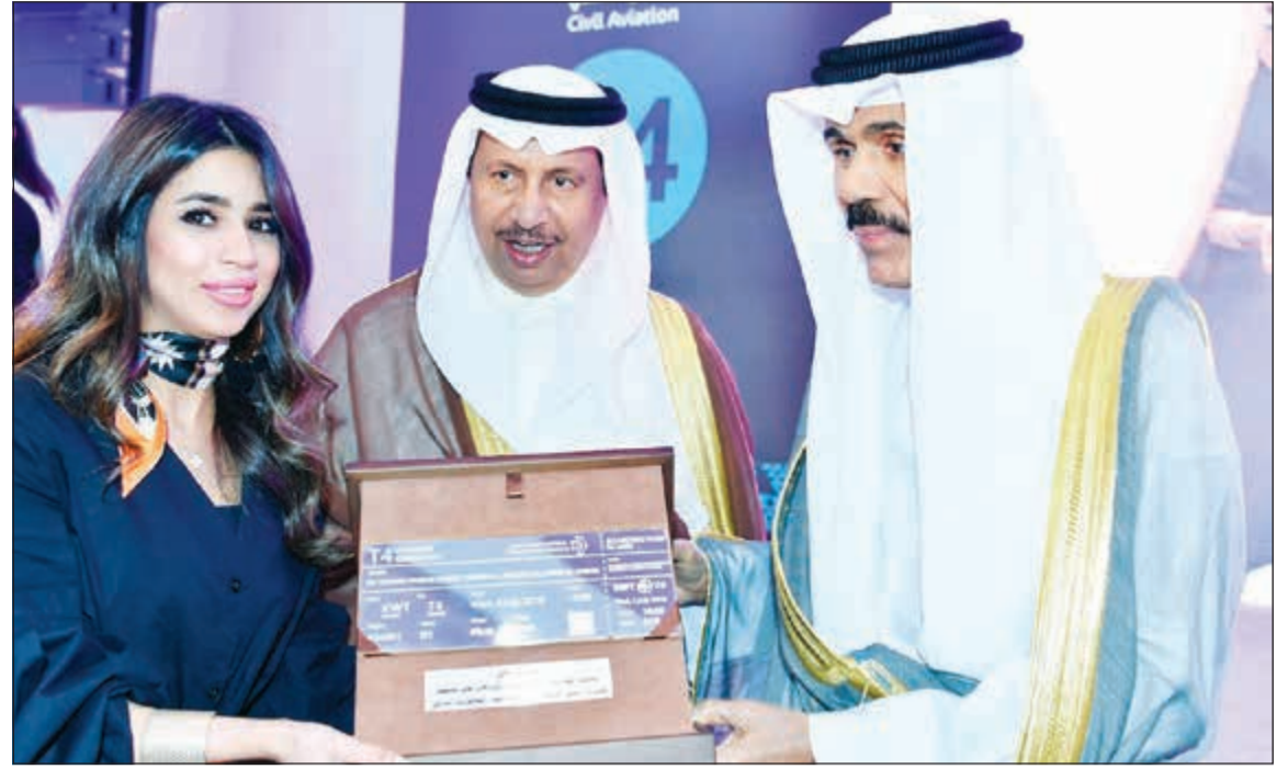
سمو ولي العهد يتلقى هدية تذكارية اثناء افتتاح مبنى الركاب بحضور سمو رئيس مجلس الوزراء