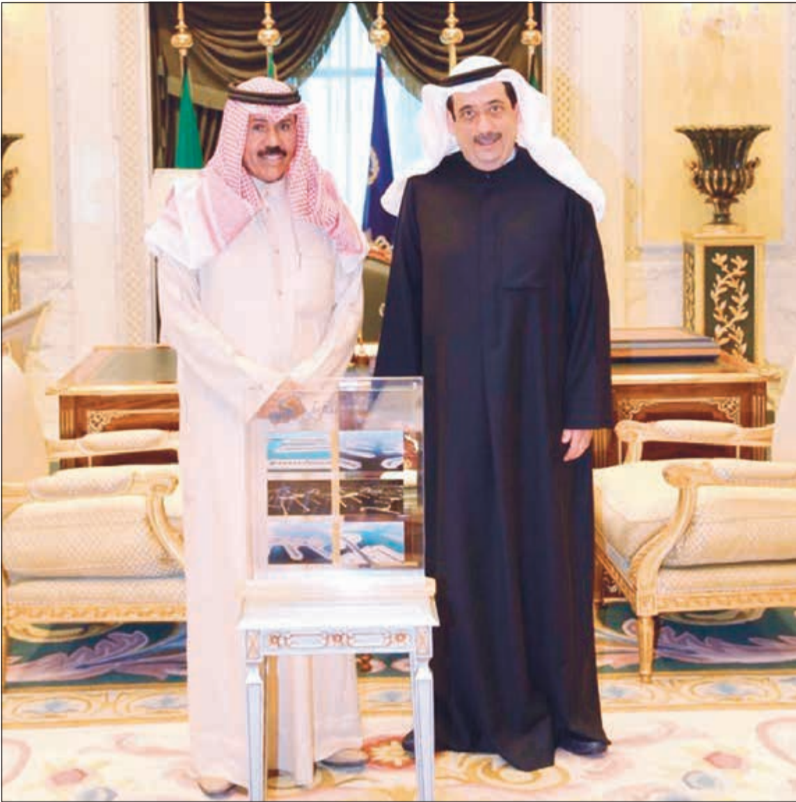
سمو ولي العهد الشيخ نواف الأحمد مستقبلاً السيد فواز خالد المرزوق الذي قدم لسموه شرحاً حول إنجاز المرحلة الرابعة لمدينة صباح الأحمد البحرية