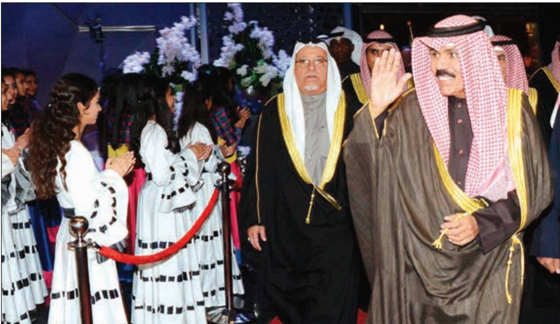
سمو ولي العهد اثناء حضوره أحد الأوبريتات برفقة وزير شؤون الديوان الأميري الشيخ علي الجراح

الفكر المستنير بدوره، قال أمين سر الجمعية الكويتية لجودة التعليم هاشم الرفاعي: يسرني اننا وزملائي أعضاء الجمعية أن نرفع إلى سمو ولي العهد الشيخ نواف الأحمد اصدق وخالص آيات التهاني بمناسبة الذكرى الثالثة عشرة لتجديد مبادئه ولنا للعلم، مؤكداً ان فكر سموه المستنير وتوجهاته الحديثة ساهمت في تسارع وتيرة الإنجازات،