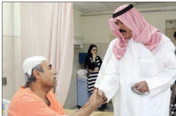
..وسموه خلال تفقده المصابين في مستشفى الأمير نتيجة التفجير الإرهابي لمسجد الصادق

ونحن جميعاً نرقي المشهد الوطني نجده ذلك الحاكم الحازم في قراراته، الحكيم ثاقب الرأي والمشورة في رؤيته للأحداث مما جعل مثاليته تطفئ على كل مثالية، إنها إنسانية وتواضع وعدل «النواف».