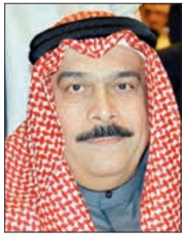
المستشار نصر سالم آل هيد

الآخر ما وجه إليه من اتهام، مؤكداً أنه وجد حشرات في غرفة أبنائه وقام بالتعامل معها بشكل طبيعي برش مبيد الحشرات ولم يعلم أن هذا التصرف سيؤدي إلى وفاة طفليه. وفيما قضت محكمة الجنابات بالامتناع عن النطق بعقاب المتهم، أيدت محكمة الاستئناف الحكم مستندة إلى إنكار المتهم ما وجه إليه من اتهامات فضلاً عن اطمئنانها إلى أقوال ودفاع المتهم.