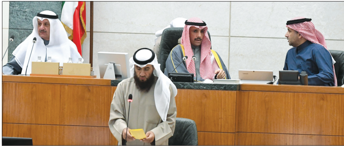
رئيس مجلس الأمة مرزوق الغانم ونائبه عيسى الكندري وأمين السر د. عودة الرويعي على المنصة ويبدو علام الكندري (ماني الشمري)

افتتح رئيس مجلس الأمة مرزوق الغانم الجلسة العادية أمس الثلاثاء عند الساعة التاسعة والنصف بعد أن كان قد رفعها لمدة نصف ساعة لعدم اكتمال النصاب، وتلا الأمين العام أسماء الأعضاء الحاضرين والمعتذرين والغائبين من دون أن أو الخطار، كما تلا أسماء أعضاء اللجان الحاضرين والغائبين عن اجتماع أو أكثر من اجتماعات اللجان منذ الجلسة السابقة.