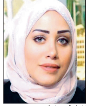
الحامية حوراء الحبيب

ألغت محكمة التمييز إدانة مواطنة بالتفجير وقضت مجدداً ببراءتها من تهمة تتعلق بالإساءة إلى متهم تحصل على البراءة بقضية تفجير مسجد الصادق. وكان المدعي قد لجأ إلى القضاء مطالباً بإدانة المتهم التي دونت تفجيراً بعد واقعة تفجير مسجد الإمام الصادق قالت فيها: حسبي الله ونعم الوكيل فيكم وبكل واحد ماشي بطريقتكم ما تعرفون الصح. وذكرت المحكمة في حياثها حكمها أنها لا ترى بهذه العبارة ما يشكل جرماً يعاقب عليها، مشيرة إلى أن المقصود بعبارة حسبي الله ونعم الوكيل أن الله كاف من قال هذه الكلمة والله تعالى وكيله في دفع الشر عنه.