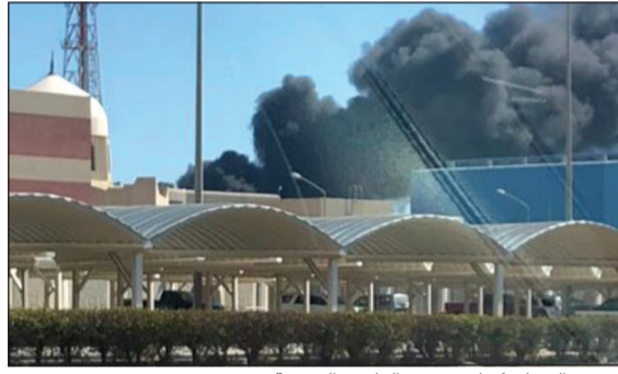
سحب الدخان كما بدت من القاعدة البحرية

أبلغ مصدر في الإدارة العامة للإطفاء بأن رجال إطفاء مركز المنقف توجهوا صباح أمس إلى قاعدة صباح الأحمد البحرية على طريق الفنطاس البحري للتعامل مع حريق. وبحسب المصدر فإن الحريق اندلع في «مرسى متحرك» داخل القاعدة البحرية وأن رجال الإطفاء تمكنوا من السيطرة على الحريق الذي خلف سحب دخانية شوهدت على مساحة بعيدة. وأكد المصدر أن القطع البحرية (الزوارق) لم تتأثر بالحريق.