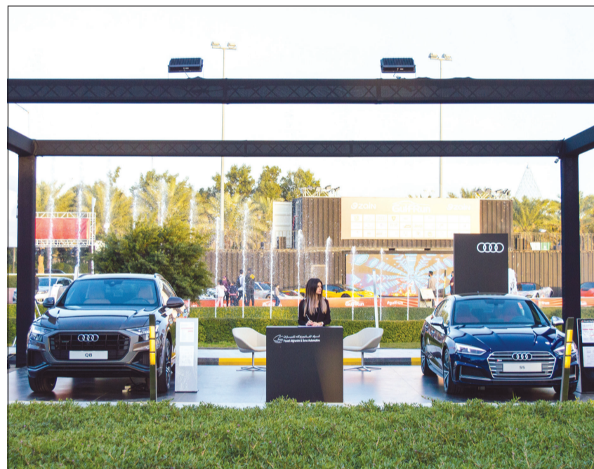
جناح الشركة في معرض GulfRun للسيارات

عرضت أودي الكويت، ممثلة في شركة فؤاد الغانم وأولاده للسيارات، سيارات من أحدث طرازاتها في معرض GulfRun السنوي للسيارات في مجمع المروج. كما عرضت أودي مجموعة متنوعة من سياراتها الأنيقة والرياضية والمزودة بأحدث التقنيات المتقدمة في السوق.