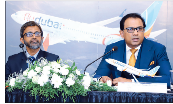
جانب من المؤتمر الصحافي

بدأت فلاي دبي رحلاتها إلى مدينة كاليكوت في ولاية كيرلا الهندية حيث هيبتت رحلتها الافتتاحية في مطار كاليكوت الدولي في الأول فبراير 2019. وستستغل الناقله رحلاتها إلى كاليكوت بواقع 3 رحلات أسبوعياً من مطار دبي الدولي (DXB) إلى مطار كاليكوت الدولي (CC) لترفع من أعداد رحلاتها إلى 30 رحلة أسبوعياً تخدم 8 محطات في الهند.