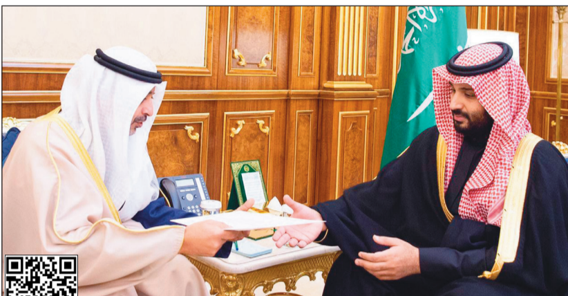
صاحب السمو الملكي الأمير محمد بن سلمان يتسلم رسالة صاحب السمو الأمير الشيخ صباح الأحمد من مبعوث سموه الشيخ محمد العبدالله