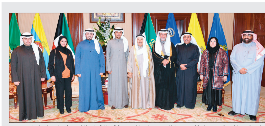
صاحب السمو الأمير الشيخ صباح الأحمد مستقبلاً رئيس مجلس إدارة جمعية الشافعية ماجد المطيري وأعضاء مجلس الإدارة

وكيل التعليم العام بالإجابة فهد الغيص، وحصلت «الأنباء» على نسخة منها، أكد فيها أنه حرصاً على مصلحة الطلبة المرزوم يتم قبولهم في مدارس التعليم العام سواء بالتسجيل أو إعادة القيد أو النقل من التعليم الخاص في أي وقت من العام الدراسي. يذكر أنه، وحسب التقويم الدراسي، كان آخر يوم للتسجيل لطلبة الابتدائي في المدارس 30 سبتمبر، أما النقل من «الخاص» إلى «العام»، فكان لمدة أسبوعين فقط بعد بدء دوام الطلبة وتصدر نشرة بذلك.