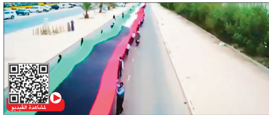
رفع أطول علم في العالم يوم الأحد المقبل في احتفالية برباعة وزير التربية

يوماً بعد يوم يتبنت أبناء الكويت عشقهم لتراب الوطن الغالي فيحققون الإنجازات لتبقى راية الوطن عالية خفاقة في مختلف المحافل الدولية، إلا أنها هذه المرة ستدخل موسوعة «غينيس» العالمية للأرقام القياسية بأطول علم على مستوى العالم، وذلك في إطار احتفالات البلاد بالأعياد الوطنية.