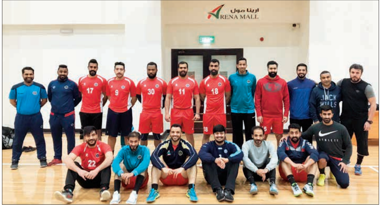
فريق اليد الأول بنادي برقان خلال معسكره في أرينا مول