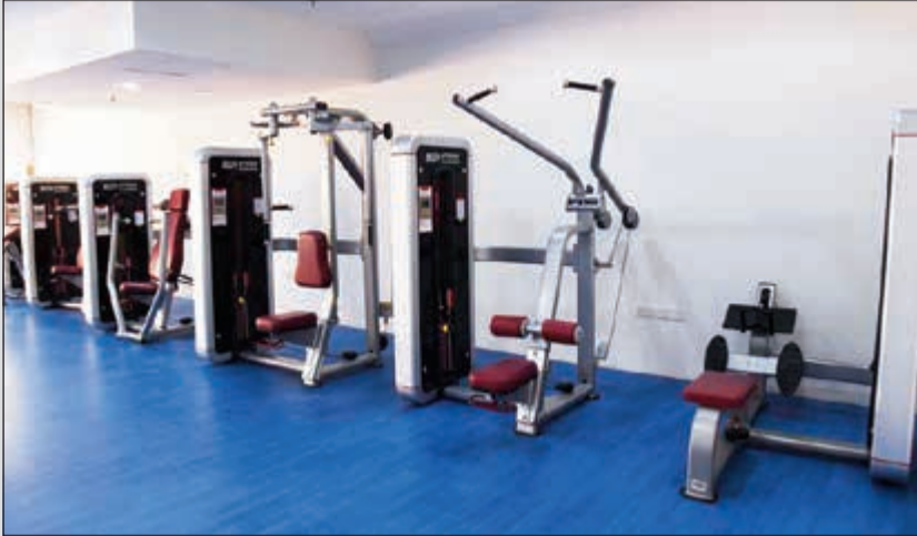
جانب من صالة الحديد