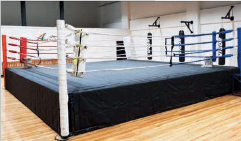
حلبة الملاكمة بمواصفات دولية