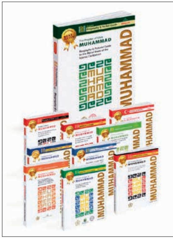
كتيبات الحملة بكل اللغات

والتشويق للتفاعل معها من خلال تقنية (PLTP: Proactive Language & Titled Paragraphs) ومن تم نقل محتوى تلك الكتب إلى مختلف وسائل العرض من بوسترات وبطاقات ووسائط إلكترونية وتفاعلية وذلك للإفادة منها في كل النشاطات الدعوية والتعليمية والثقافية. ويعتبر دليل الجيب المصور للتعريف بالنبي ﷺ من أهم إصدارات المشروع فهو متوافر بكل اللغات العالمية وتم تصميمه