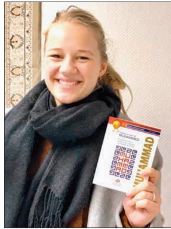
فتاة نرويجية تحمل الكتاب

كما يرتكز المشروع على إصدارات متميزة من الكتب المصورة والتي تمت ترجمتها لأكثر من عشرين ترجمة وإصدارها بمواصفات أدلة الجيب العالمية والتي تعتمد على التبسيط في عرض المادة