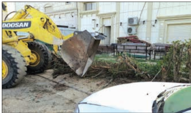
جانب من إزالة التعديات في الفروانية

والعراضية والرقيعي والعراضية الصناعية بإدارة النظافة العامة وإشغالات الطرق بالفروانية بحملة نظافة أسفرت عن رفع حمولة 3م400 من المخلفات إلى جانب رفع 10 سيارات فضلاً عن كنس وتنظيف الشوارع الرئيسية والداخلية للمناطق. من جهة أخرى، نفذت مراكز نظافة خططان والفروانية والعمرية والرابية وإشبيلية والرحاب بإدارة النظافة العامة بالفروانية حملة نظافة مكثفة أسفرت عن رفع حمولة 3م550 من المخلفات إلى جانب وضع 150 ملصقا فضلاً عن رفع 15 سيارة وتبديل 50 حاوية وتنظيف الشوارع الرئيسية والداخلية للمناطق.