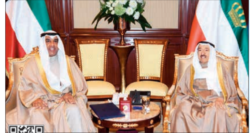
صاحب السمو الأمير الشيخ صباح الأحمد مستقبلاً المستشار عبدالرحمن النمش