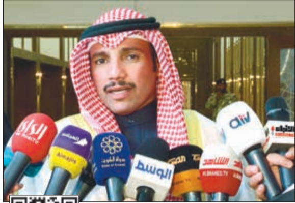
رئيس المجلس مرزوق الغانم يتحدث للمصاحفين (رئيس كومان)

يجل رئيس مجلس الأمة مرزوق الغانم مساء اليوم ضيفا على برنامج «10 إله عشرة» في قناة الراي وذلك للحديث عن العديد من القضايا المثارة على الساحة السياسية حاليا ولعل أبرزها قضية إعلان خلو مقعدي الطبطيني والحربش والجدل الدستوري والقانوني الذي أثير حول هذا الموضوع بالإضافة إلى الإجراءات التي اتخذها أثناء سير جلسة أمس وردود الفعل الخيابة حول الموضوع.