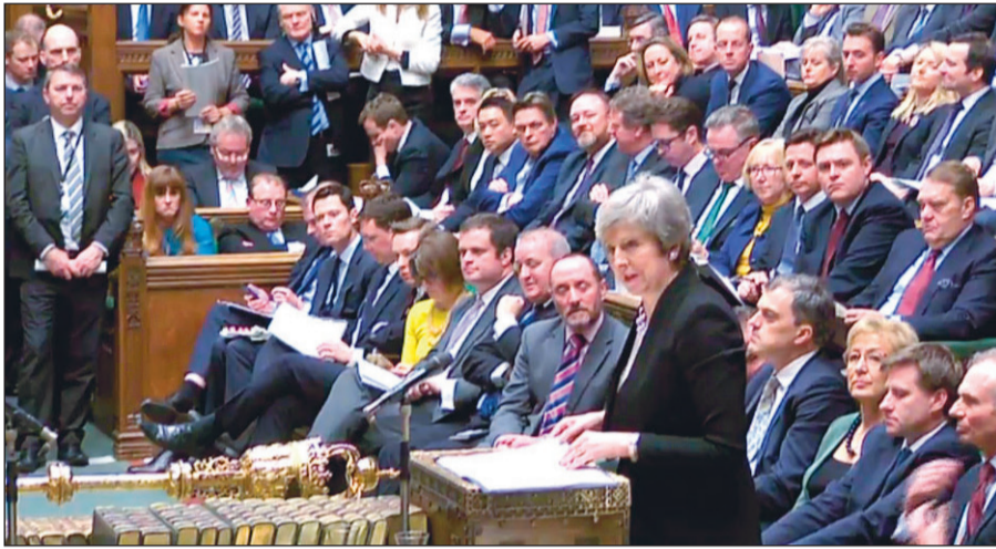
رئيسة الوزراء البريطانية تيريزا ماي خلال مناظرة حول «خطة B» في البرلمان أمس (أ.ف.ب)

داخل حزب المحافظين المتصارع. وأشارت الصحفية إلى أن التكتل الأوروبي يبدو أنه سيرفض بالتأكيد الخطة الجديدة حتى وإن تبنتها الحكومة. وتتضمن الخطة ضمان فترة انتقالية أطول حتى في حالة رفض الاتحاد الأوروبي ذلك، واستبدال سياسة «مساندة إيرلندا» الحالية التي تم إعدادها لمنع عودة إجراءات التفتيش عند الحدود الإيرلندية. ولفتت الصحفية إلى أنه من غير الواضح ما إذا كانت تيريزا ماي أبدت هذه المحادثات، رغم أن وزيرة التعليم البريطانية السابقة، نيكى مورغان (المؤيدة للبقاء في الاتحاد الأوروبي) أصرت على أن ماي كانت على علم بهذا الاتفاق الجديد. ومع ذلك، قالت مورغان إن هذه الخطة قد تكللت بالنجاح، إذ أكدت أنه يوجد أشخاص مثلها يريدون تجنب عواقب بريكست بدون اتفاق ومضادة التكتل، موضحة أنها على استعداد للتوصل لحل وسط من أجل تحقيق ذلك. واستبعد الاتحاد الأوروبي حتى الآن إعادة فتح اتفاق الخروج الذي قالت ماي إنه لازم كي تجري تغييرات قانونية للترتيب الخاص بإيرلندا وهو بند يلزم بريطانيا بتأجيل قواعد الاتحاد الأوروبي التجارية لحين إيجاد طريقة أفضل لتجنب فرض قيود حدودية صارمة عبر جزيرة إيرلندا.