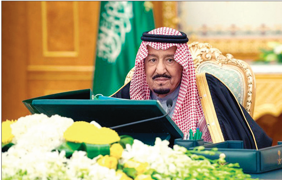
خادم الحرمين الملك سلمان بن عبدالعزيز مترسدا جلسة مجلس الوزراء في الرياض أمس (واس)

الرياض - واس: رأس خادم الحرمين الشريفين الملك سلمان بن عبدالعزيز الجلسة التي عقدها مجلس الوزراء في قصر اليمامة بمدينة الرياض أمس. وأوضح وزير الإعلام تركي بن عبدالله الشبانة، في بيان له لوكالة الأنباء السعودية الرسمية «واس» أن مجلس الوزراء شدد في بداية الجلسة، على أن تضامن المملكة مع السودان في مواجهة التحديات الاقتصادية الراهنة، يجسد مواقفها الثابتة بقيادة خادم الحرمين الشريفين مع الدول الشقيقة والحرص على أمنها واستقرارها، مقدرا في هذا الشأن تأكيد الملك سلمان أن أمن السودان أمن للمملكة واستقراره استقرار لها، وبعثه وفدا وزاريا لتعزيز العلاقات الاقتصادية وزيادة التبادل التجاري بين البلدين.