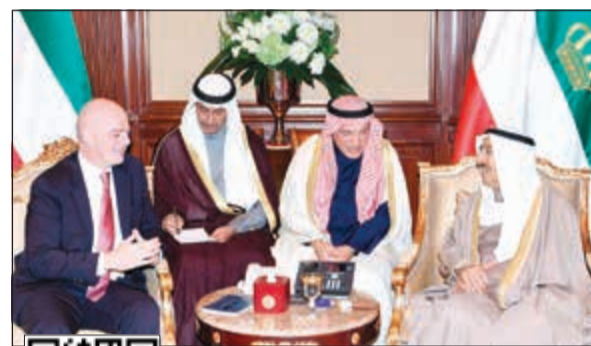
سمو الأمير الشيخ صباح الأحمد مستقبلاً رئيس «فيفا» جيانى إنفانتينو

والتي جمعت البلدين والشعبين الشقيقين، مقدراً لجلالته المواقف الأخوية النبيلة لسموه تجاه المملكة الأردنية الهاشمية الشقيقة، والتأكيد على توسيع آفاق التعاون الثنائي وبمختلف القضايا بما يسهم في تفعيل التعاون العربي المشترك لمواجهة مختلف التحديات، كما تضمنت دعوة سموه رعاه الله لزيارة المملكة الأردنية الهاشمية الشقيقة. كما استقبل سموه رعاه