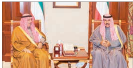
سمو ولي العهد الشيخ نواف الأحمد مستقبلاً الشيخ د.محمد الصباح

استقبل سمو ولي العهد الشيخ نواف الأحمد بقصر بيان صباح أمير دولة الكويت ورئيس مجلس الأعيان في المملكة الأردنية الهاشمية فيصل الفايز، حيث سلم سموه رسالة خطية من أخيه صاحب الجلالة الهاشمية الملك عبدالله الثاني بن الحسين ملك المملكة الأردنية الهاشمية الشقيقة تتعلق بالعلاقات الأخوية