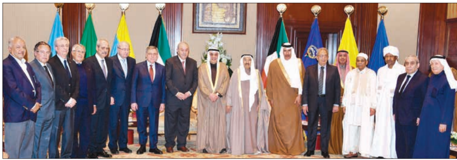
صاحب السمو الأمير الشيخ صباح الأحمد مستقبلاً رئيس مجلس العلاقات العربية والدولية محمد الصقر وأعضاء المجلس