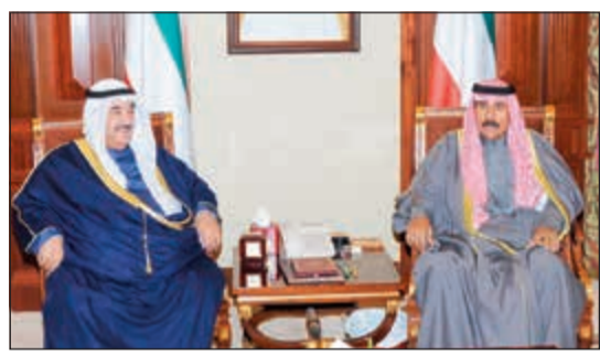
سمو ولي العهد الشيخ نواف الأحمد مستقبلاً سمو الشيخ ناصر المحمد