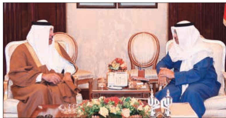
سمو الشيخ جابر المبارك مستقبلاً الشيخ حمد بن جاسم

استقبل سمو رئيس مجلس الوزراء الشيخ جابر المبارك في قصر بيان أمس دولة رئيس مجلس الأعيان في المملكة الأردنية الهاشمية الشقيقة فيصل عاكف الفايز والوفد المرافق له وذلك بمناسبة زيارته للبلاد. حضر المقابلة رئيس بعثة الشرف المرافقة النائب د.عودة الرويعي ورئيس ديوان رئيس مجلس الوزراء الشيخة اعتماد الخالد.