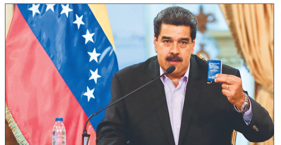
الرئيس الفنزويلي نيكولاس مادورو ممسكاً بنسخة من الدستور خلال اجتماعه ببديلوماسي بلاده العائدين من واشنطن أمس الأول

عواصم - وكالات: طلب النائب العام في فنزويلا طارق وليم صعب أمس من المحكمة العليا منع المعارض خوان غوايدو الذي أعلن نفسه رئيساً بالوكالة، من مغادرة البلاد وتجميد حساباته المصرفية. وأعلن النائب العام المعروف بقربه من الرئيس نيكولاس مادورو في مؤتمر صحفي فتح «تحقيق أولي»، طالباً اتخاذ «إجراءات وقائية» بحق غوايدو، من بينها «منع من مغادرة البلاد» و«تجميد حساباته». وفي المقابل، صعد غوايدو تصريحاته معلناً أنه «الرئيس الشرعي الوحيد للبلاد،