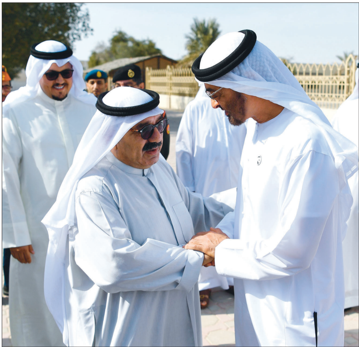
ولي عهد أبوظبي صاحب السمو الشيخ محمد بن زايد مرحباً بالنائب الأول ووزير الدفاع الشيخ ناصر صباح الأحمد في الإمارات أمس

أعلن مقرر اللجنة التشريعية النائب د. خليل عبدالله عن إجماع أعضاء اللجنة على عدم دستورية الاستجواب المقدم من النائب شعيب الموزيري لسو رئيس مجلس الوزراء الشيخ جابر المبارك. وأضاف عبدالله أن اللجنة قررت في اجتماعها أمس النظر في الجند الوحيد على جدول الأعمال والخاص بمدى دستورية الاستجواب المتعلق بفشل وزارات الدولة في إدارة الكوارث ومواجهة الأزمات المحال إلى اللجنة بقرار من المجلس في جلسة الثلاثاء الموافق 2018/11/25. وقال عبدالله إنه بعد عدة اجتماعات وبعد الاستماع إلى رأي الحكومة المقدم من وزير العدل وعدد من