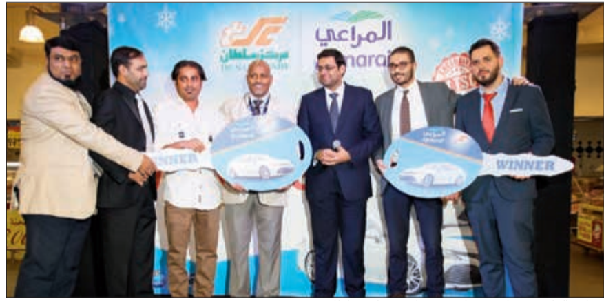
تسليم الفائزين مفتاح سيارة تويوتا من مركز سلطان

وأضاف أن «حملة كامري تويوتا مثال لما يمكن لعملاء مركز سلطان توقعه في عام 2019 وما بعده».