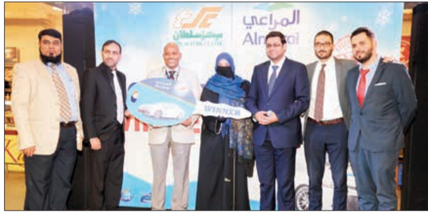
تكريم الفائزة بسيارة تويوتا ضمن حملة اشتر واربح