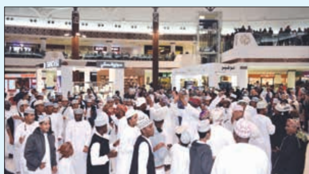
تفاعل الجمهور مع فرقة الفهود العمانيّة

الوطنية الكويتية، وتضمنت الاحتفالية زيارة خاصة من الفنان عبدالعزيز المرفج المعروف باسم شادي الخليج الذي أسعد الجمهور بحضوره وأعادهم للزمن الجميل. وصرح فريق الاتصال والتسويق لجمع بوليفارد بأنهم فخورون بهذه الفعالية ويكونهم أول من يهنئ الكويت بعيدها خصوصا مع الأشقاء العمانيين وبأنهم سعداء جدا بتفاعل زوار المجمع مع هذا النوع من الفعاليات التي تدل على حب الكويت.