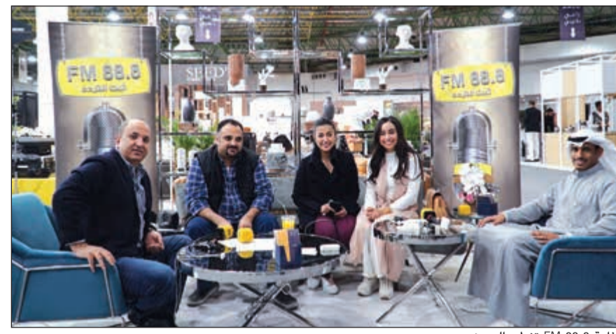
إذاعة FM 88.8 تعطي الحدث