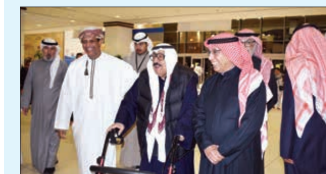
شادي الخليج شارك الحضور فرحتهم