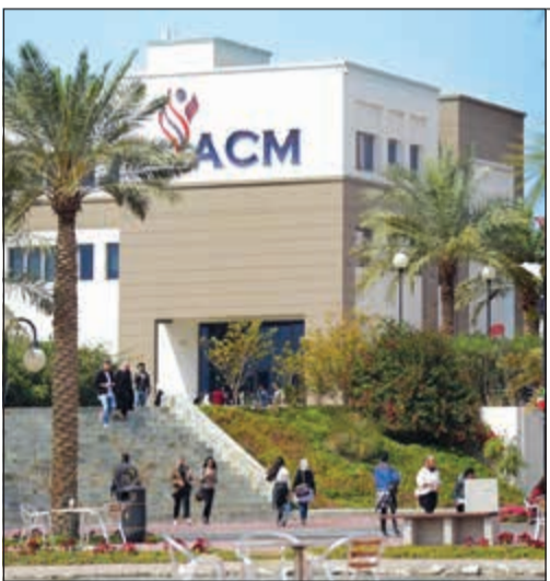
كلية الشرق الأوسط الأمريكية تحصل على الاعتماد الأكاديمي الدولي من ACBSP

تاكيداً لما انفردت بنشره «الأنباء» في 10 الجاري، قالت مصادر مطلعة في تصريحات خاصة لـ «الأنباء» إن عطلة العيد الوطني ويوم التحرير ستكون 5 أيام، وأوضحت المصادر أن الأعياد الوطنية ستوافق يومي الاثنين والثلاثاء 25 و26 فبراير المقبل. وأضافت المصادر أن مجلس الوزراء اعتبر يوم الأحد الموافق 24 من الشهر ذاته يوم راحة لوقوعه بين يوم السبت وهو يوم راحة ويوم الاثنين وهو عطلة رسمية، واعتبار الأحد في هذه الحالة يوم راحة، وبذلك تكون عطلة العيد الوطني 5 أيام هي على التوالي أيام الجمعة والسبت والأحد والاثنين والثلاثاء الموافق 22 و23 و24 و25 و26. ويستأنف الدوام الرسمي الأربعاء 27 فبراير.