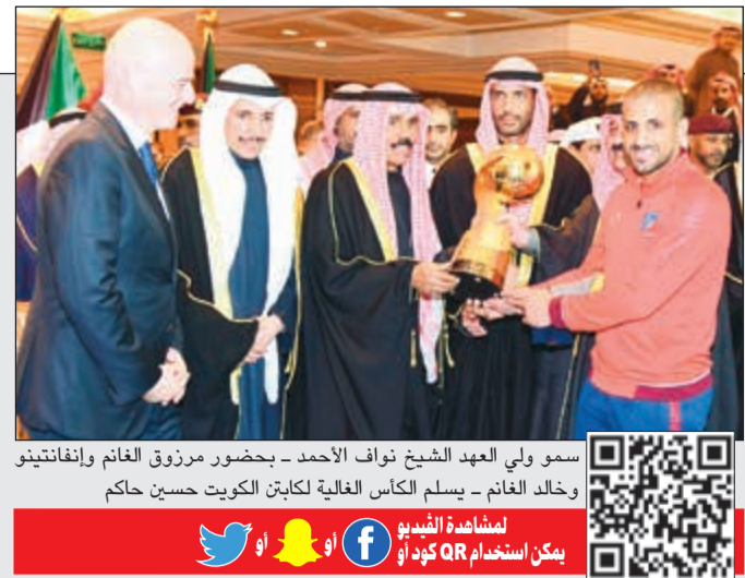
سمو ولي العهد الشيخ نواف الأحمد - بحضور مرزوق الغانم وإيفانغيتينو وخالد الغانم - يسلم الكأس الغالية لكابتن الكويت حسين حاكم

كأس ولي العهد لـ «العهد» للمرة السابعة في تاريخه