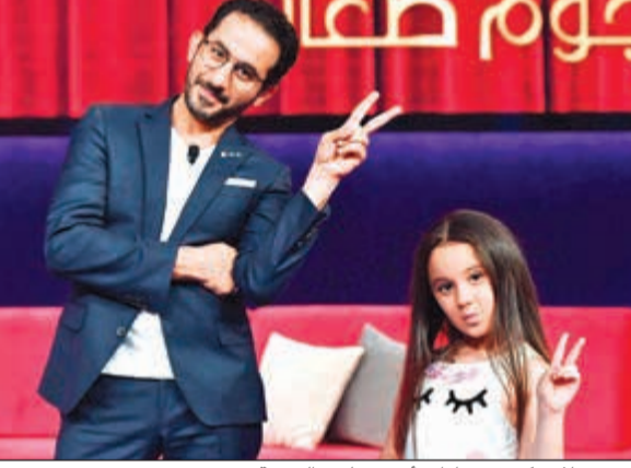
ميس حلاوة كشفت عادات أحمد حلمي اليومية