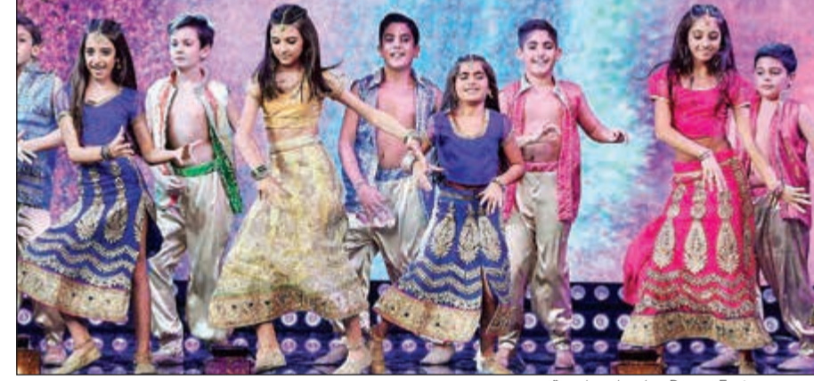
فريق «Dance Factory» ولوحات راقصة مبهرة