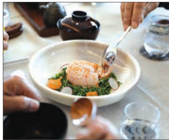
سلطة الطماطم من مطعم أميموتو

ندى أبوشرع عقدت شركة المشروعات السياحية مؤخرًا لقاءً خاصًا لمطلي وسائل الإعلام المحلية، وذلك لتكريمهم في مستهل العام الجديد وللإعجاب لهم عن الامتنان والشكر لدعمهم المستمر. وفي هذه المناسبة، أقامت الشركة حفل غداء لمطلي الصحف والمجلات ومحطات التلفزيون في مطعم «أميموتو» الياباني، في أبراج الكويت. ونظمت الإدارة العليا في شركة المشروعات السياحية جولة لمطلي وسائل الإعلام في أبراج الكويت، واستمتع المشاركون في الجولة برؤية أفق مدينة الكويت بأبراجها الشاهقة والمساحات الخضراء وشاطئ البحر. وشملت الجولة «الكرة الكاشفة» والتي تتضمن