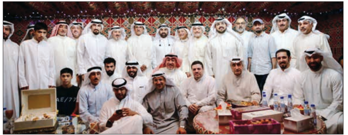
جانب من حفل التكريم

شفتي المباديين العلمية والثقافية والرياضية أو من خلال عمله ولن وضعوا بصمة واضحة وتميزاً في ميدان العمل الوطني مما يدفعنا لدعمهم ومساندتهم