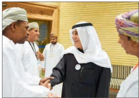
معرفةي مستقبلاً ضيوف الكويت في ديوان آل معرفةي