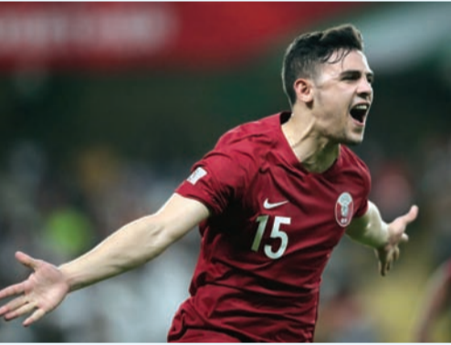
الدوحة - فريد عبد الباقى

أسندت لجنة الحكام بالبطولة إدارة لقاء منتخب قطر ونظيره الكوري الجنوبي اليوم بالـ دور ربع النهائي لبطولة كأس أمم آسيا إلى الحكم الأوزبكي المعروف رافشان إيرماتوف، ويعد إيرماتوف من أفضل حكام القارة، ويساعده مواطناه رسلوف كميديف وسيديف جكانغير.