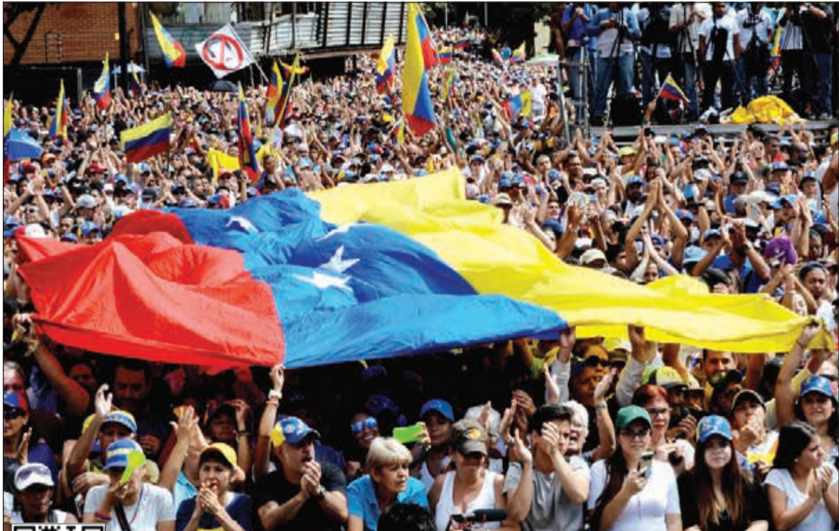
الآلاف تظاهروا في العاصمة كراكاس امس الاول للمطالبة برحيل الرئيس مادورو