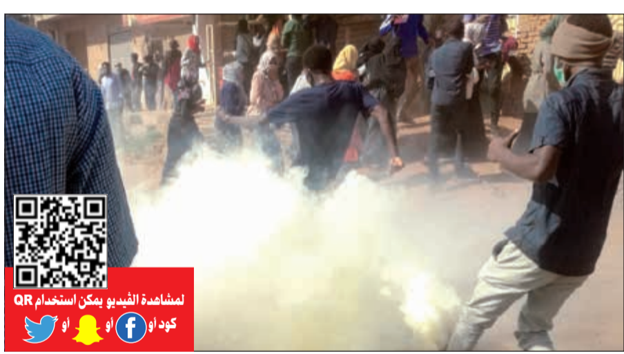
سودانيون يحاولون تجنب قنابل الغاز المسيل للدموع التي أطلقتها الشرطة لمنعهم من الوصول للمقر الرئاسي في الخرطوم امس

أحد عناصر جهاز الاستخبارات السوداني في اشتباك مع مجموعة من الجنود في بلدة بورتسودان المطلة على البحر الأحمر، وفقا للشرطة. والواقعة هي الأولى من نوعها بين قوات الأمن والجيش منذ بدء موجة من الاحتجاجات المناهضة للحكومة السودانية منذ 19 ديسمبر الماضي. ووقع الاشتباك بين عناصر من جهاز الأمن والمخابرات الوطني السوداني القوي ومجموعة من الجنود في ساعة متأخرة من