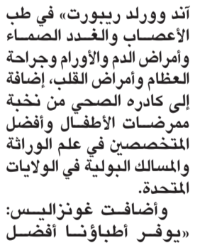
«كوك تشلدرنز» لنظام العناية بصحة العظام