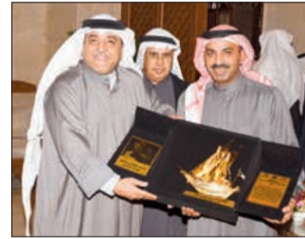
فيصل العمر يكرم طارق العلي

أقام ديوان فيصل العمر بمنطقة السرة حفل تكريم للفنان القدير طارق العلي والفنان الشامل المبدع حسن البلاد والشاعر والفنان طاهر النجادة ود.عبدالعزیز علي صويلح نائب رئيس جمعية تاريخ وآثار البحرين وعضو جمعية التاريخ والآثار لدول الخليج العربية. وقد تخلل الحفل كلمة للفنان طارق العلي عن دور الفن في المجتمعات العربية عامة والمجتمع الكويتي خاصة فضلا عن كلمة أخرى عن الفن الكوميدي ودوره في حياة الشعوب للفنان حسن البلاد، كما تطرق الشاعر والفنان طاهر النجادة إلى علاقة الفن بالشعر.