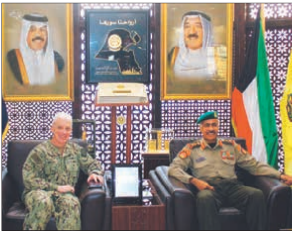
الفريق الركن محمد الخضرم مستقبلاً الفريق بحري جون مالوي

استقبل رئيس الأركان العامة للجيش الفريق الركن محمد الخضرم، في مكتبه صباح أمس، قائد القوات البحرية الأمريكية الوسطى والأسطول الخامس الفريق بحري جون مالوي بمناسبة زيارته للبلاد. وتم خلال اللقاء مناقشة أهم الأمور والمواضيع ذات الاهتمام المشترك، لاسيما المتعلقة بالجوانب العسكرية وسبل تطويرها وتعزيزها. حضر اللقاء معاون رئيس الأركان العامة لهيئة العمليات والخطط اللواء الركن محمد الكندري ورئيس مكتب التعاون العسكري الأمريكي لدى البلاد العميد راندولف ستاندروص.