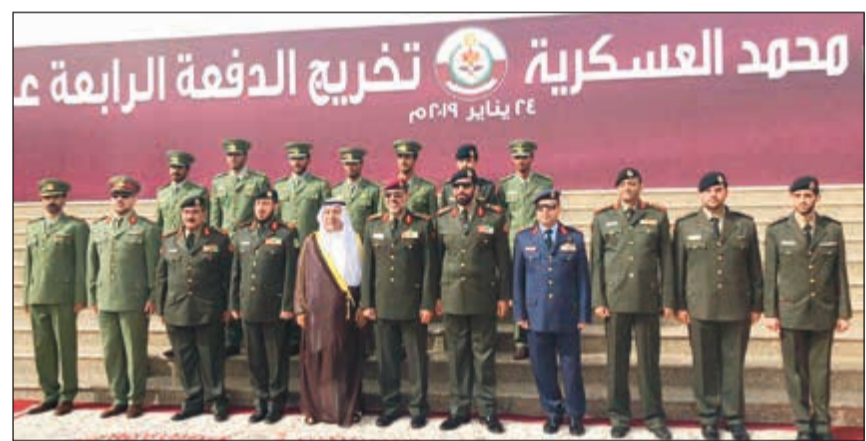
الفريق الركن الشيخ عبدالله النواف والسفير حفيظ العجمي والعميد الركن هويدى الهاجري مع عدد من الضباط الخريجين

من جانبه، قدم مدير مديرية التدريب في الحرس الوطني العميد الركن ناصر يعقوب الشكر إلى القائمين على كلية أحمد بن محمد العسكريين من مربيين وإداريين على الجهود الواضحة التي بذلت للوصول بالطلبة الضباط في الحرس الوطني إلى مستوى متميز، داعياً الضباط الخريجين إلى مواصلة التحصيل العلمي وتطوير مستوياتهم ليرتقوا بالعمل كلا في موقعه. هذا وضم وفد الحرس الوطني أمر مدرسة تدريب الضباط المقدم الركن عيسى ياسين محمد.