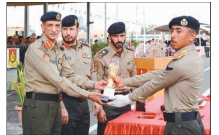
اللواء الركن وليد السريدي مكرماً الحاصل على المركز الأول في التفوق الدراسي

استحسان الحضور، وفي الختام تفضل راعي الحفل اللواء الركن اللواء الموسى بإعلان النتائج، تلا ذلك أداء الخريجين للقسم القانوني، هذا وقد حضر حفل التخرج عدد من كبار ضباط القادة بالجيش وجمع غفير من أهالي الخريجين. بعد ذلك قام مساعد أمر مدرسة تدريب الأفراد العميد الركن بحري مساعد أحمد الموسى بإعلان النتائج، تلا ذلك أداء الخريجين للقسم القانوني، هذا وقد حضر حفل التخرج عدد من كبار ضباط القادة بالجيش وجمع غفير من أهالي الخريجين.