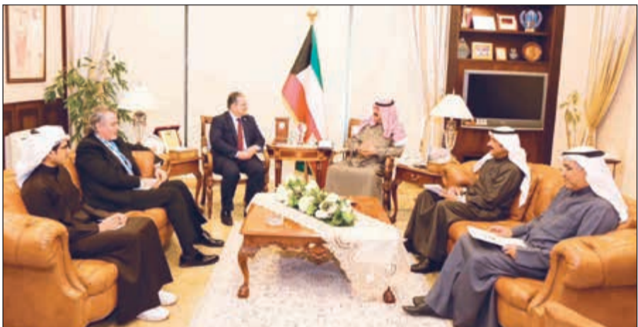
نائب وزير الخارجية خالد الجارالله مستقبلاً ممثل الأمين العام للأمم المتحدة في الكويت د. طارق الشيخ

المستشار حمد المشعان. كما اجتمع الجارالله في وقت لاحق مع ممثل الأمين العام للأمم المتحدة في الكويت د. طارق الشيخ حيث تم خلال اللقاء بحث أوجه العلاقة المتميزة بين الكويت والأمم المتحدة. وأعرب د.الشيخ عن بالغ التقدير للدعم الذي تقدمه الكويت للأمم المتحدة وبعثتها في البلاد. وحضر اللقاء مساعد وزير الخارجية لشؤون مكتب نائب الوزير السفير أيهم العمر ونائب مساعد وزير الخارجية لشؤون المنظمات الدولية المستشار عبدالعزيز الجارالله.