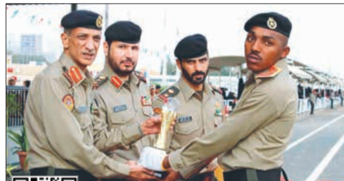
.. ومكرماً صاحب المركز الأول في التفوق الرياضي

استحسان الحضور، وفي الختام تفضل راعي الحفل اللواء الركن اللواء الموسى بإعلان النتائج، تلا ذلك أداء الخريجين للقسم القانوني، هذا وقد حضر حفل التخرج عدد من كبار ضباط القادة بالجيش وجمع غفير من أهالي الخريجين. بعد ذلك قام مساعد أمر مدرسة تدريب الأفراد العميد الركن بحري مساعد أحمد الموسى بإعلان النتائج، تلا ذلك أداء الخريجين للقسم القانوني، هذا وقد حضر حفل التخرج عدد من كبار ضباط القادة بالجيش وجمع غفير من أهالي الخريجين.