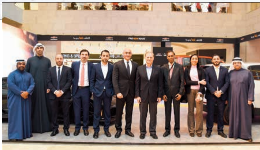
فريق عمل «شفروليه الغانم»

فرملة التوقف الإلكتروني وميزة دخول المركبة بدون مفتاح. ولا تقتصر مزايا أحدث طرازات كامارو على الأداء والتكنولوجيا فقط، بل تشمل أيضا أرقى مزايا الأمان والسلامة مثل نظام StabiliTrak للتحكم الإلكتروني بالثبات وكاميرا الرؤية الخلفية مع نظام المساعدة على الركن الخلفي، بالإضافة إلى الوسائد الهوائية القياسية وتلك الجديدة لمنطقة راحة السائق والراكب الأمامي.