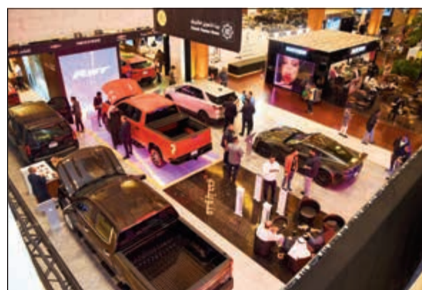
جناح «شفروليه الغانم»

الواعة في آن واحد، وتعد بليزر رمزا للقوة والموثوقية بفضل نظام التعليق الخاص بها المطور والسرعة الاستجابية، مع محرك 3,6 ليترات بقوة 305 حصنة، فضلا عن ناقل الحركة الأوتوماتيكي بـ 9 سرعات. هذا ويمكن نظام المساعدة الكهربائي من التحكم بالمقود لقيادة سلسلة ومرحة على الطرقات. وتنعكس بليزر الجديدة بتصميمها الفريد وتفاصيلها المنقطة كل ما يميز شفروليه على كل من المرايا الخارجية من الشبك الأمامي المزود والتصميم الجريء للواجهة والمصايح الأمامية، بالإضافة إلى ارتفاع مقعدار 218 مم عن الأرض مما يمنحها حضورا قويا واندماجا متكاملا من الداخل والخارج. وقد زودت بليزر 2019 بمصايح أمامية بتصميم جديد يتماشى تماما مع الهيكل القوي لهذه المركبة.