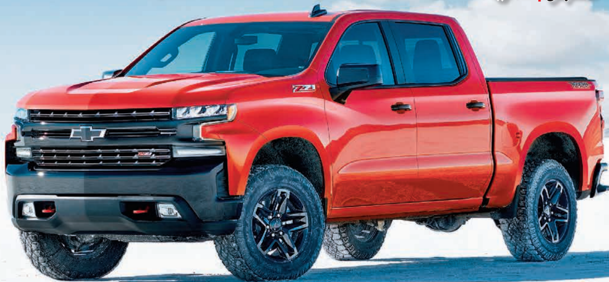
سيلفاردو 'تريل بوس'

عروض مميزة على كل السيارات خلال فترة المعرض