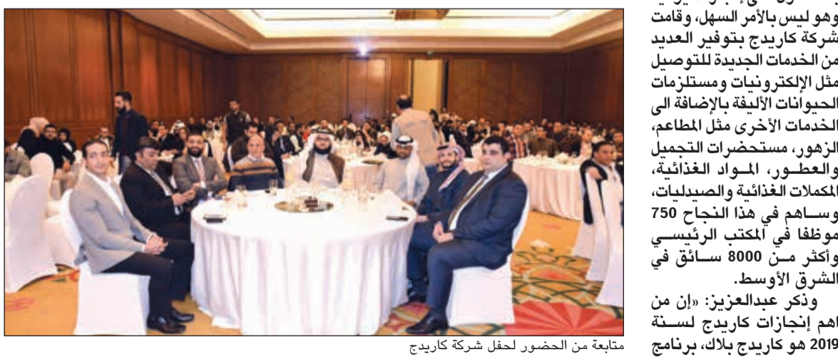
متابعة من الحضور لحفل شركة كاريدج