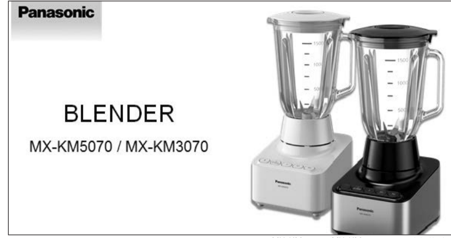
خلاطا باناسونيك MX-KM5070 و MX-KM3070