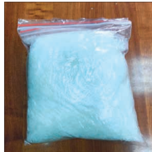
الشبو بعد ضبطه في «العبدلي»