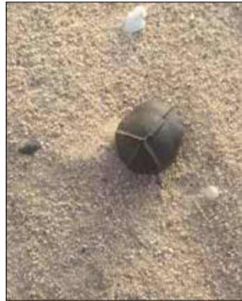
اللغم قبل التعامل معه من قبل إدارة المتفجرات

تمكن رجال ادارة المتفجرات يوم امس من تفكيك لغم تبين انه من مخلفات الغزو العراقي. وكان رجال مديرية أمن الجبراء قد اتخذوا ما يلزم من اجراءات احترازية بوضع سياج بلاستيكي حول اللغم لحين وصول فريق من ادارة المتفجرات للتعامل معه. وبحسب مصدر امني فان مواطناً ابلغ عمليات الداخلية بأنه خلال رحلة البحث في البر شاهد جسماً غريباً إلى جوار دوار رحية واكتشف أنه لغم، وعلى الفور توجه إلى موقع البلاغ رجال الأمن، وقال لهم إنه لغم ليتم إخطار إدارة المتفجرات التي قامت بتفكيكه.