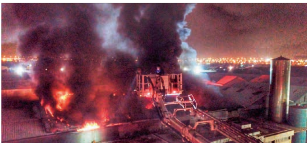
الادخنة الناجمة عن الحريق غطت سماء الشويخ الصناعية