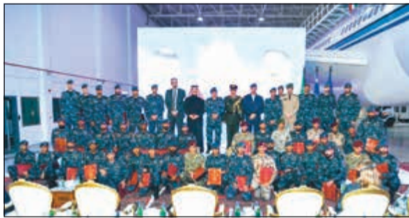
صورة جماعية للمشاركين في الدورة التأسيسية لأمن وحماية الطائرات

اختتمت صباح أمس الدورة التأسيسية الـ 40 لأمن وحماية الطائرات التي أقيمت بمعسكر الإدارة العامة لقوات الأمن الخاص واجتياز الدورة 40 متدرباً منهم متدربين من وزارة الدفاع، ومتدربين من المملكة الأردنية الهاشمية وثلاثة من المملكة العربية السعودية.