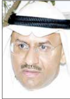
المستشار ضرار العسوسى