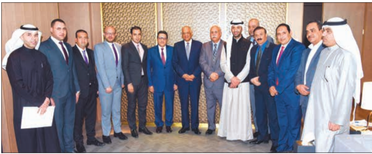
رئيس مجلس النواب المصري د.علي عبدالعال والسفير طارق القوني وممثل وسائل الإعلام (أحمد علي)

وأضاف أن زيارته إلى الكويت جاءت بدعوة كريمة من رئيس مجلس الأمة مرزوق الغانم، والذي تربطه به صداقة منذ أن كان عضواً في المجلس، فهو شاب تعلم على أيدي الحكيم رئيس المجلس الأسبق جاسم الخرافي، مما أكسبه العديد من الخبرات جعلته يتبرأ من مجلس الأمة، لافتاً إلى أن دوره الخارجي على مستوى البرلمان الدولي، أو البرلمان العربي لا