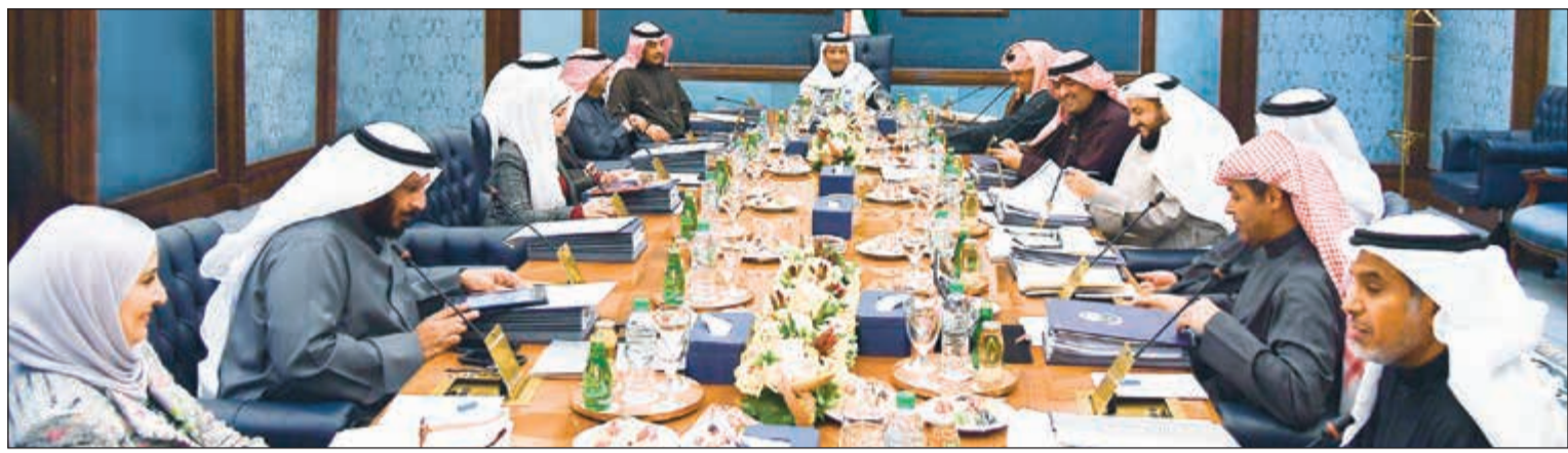
سمو رئيس مجلس الوزراء الشيخ جابر المبارك خلال الاجتماع لمجلس الوزراء

كما أعرب المجلس كذلك عن بالغ أسفه جراء حادث انفجار خط أنابيب في وسط المكسيك مؤخرا والذي أسفر عن سقوط أعداد كبيرة من الضحايا والمصابين.