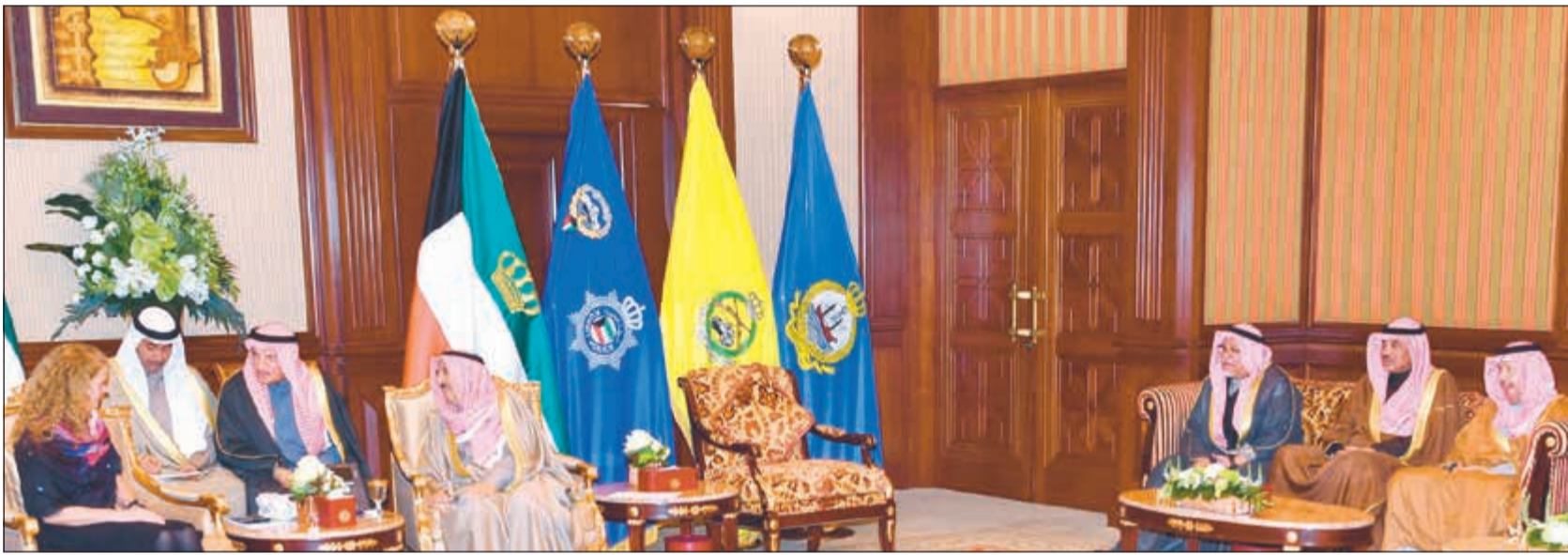
صاحب السمو الأمير الشيخ صباح الأحمد مستقبلاً حاكم كندا جولي باييت بحضور الشيخ علي الجراح والشيخ صباح الخالد والسفير أحمد فهد الفهد

ولي العهد استقبل الخالد والفاضل ونائب رئيس مجلس الإدارة والرئيس التنفيذي لمؤسسة البترول وأعضاء مجلس الإدارة وتسلم نسخة من المصحف الشريف