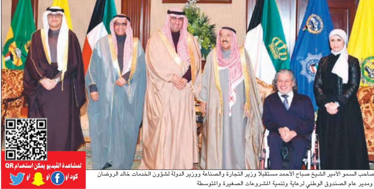
صاحب السمو الأمير الشيخ صباح الأحمد مستقبلاً وزير التجارة والصناعة ووزير الدولة لشؤون الخدمات خالد الروضان ومدير عام الصندوق الوطني لرعاية وتنمية المشروعات الصغيرة والمتوسطة

قالت الهيئة العامة للبيئة إنها رصدت الاختراقات التي تمت على محمية صباح الأحمد من قبل بعض الأشخاص مبيئة أنه تمت إحالتهم للنيابة العامة وجار استكمال التحري وجمع الاستدلالات عن السيارات المرصودة من قبل وزارة الداخلية. وأهابت الهيئة بالمواطنين والمقيمين إلى عدم الاقتراب أو الدخول إلى المحميات الطبيعية والمحددة باللون الأخضر بالخريطة وضرورة الالتزام بقانون حماية البيئة رقم (42/2014) وشددت في بيان صحافي لـ «كونا» أمس الاثنين على عدم إقامة المخيمات في المحميات أو بالقرب منها على أن يبتعد المخيم بما لا يقل عن 500 متر عن حدود أسوار المحميات وعدم التعدي على البيئة من خلال قلع النباتات أو ممارسة أي أنشطة أخرى بالمنطقة المحظورة، مؤكدة أنه سيتم اتخاذ الإجراءات القانونية بحق المخالفين.