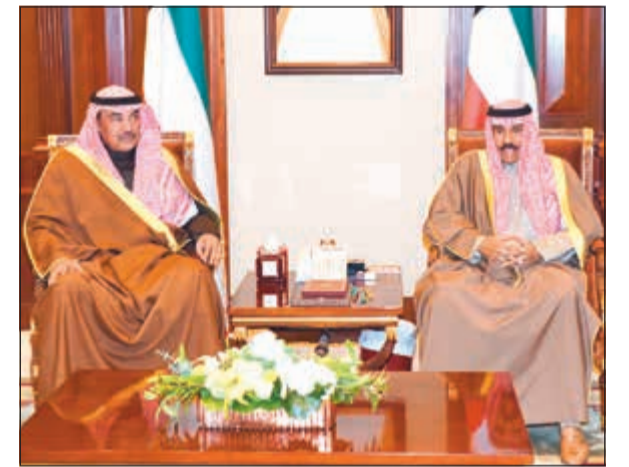
سمو ولي العهد الشيخ نواف الأحمد مستقبلاً الشيخ صباح الخالد