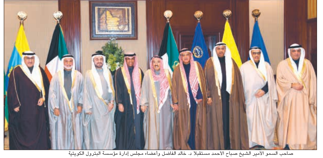
صاحب السمو الأمير الشيخ صباح الأحمد مستقبلاً د. خالد الفاضل وأعضاء مجلس إدارة مؤسسة البترول الكويتية