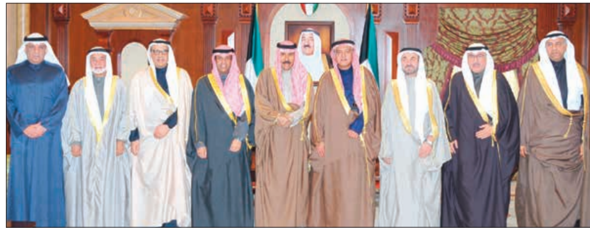
سمو ولي العهد الشيخ نواف الأحمد مستقبلاً د. خالد الفاضل وأعضاء مجلس إدارة مؤسسة البترول الكويتية