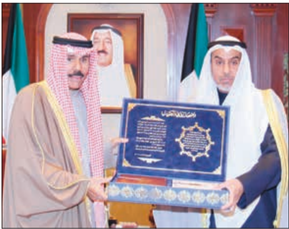
سمو ولي العهد يتسلم المصحف الشريف من فهد الشعلة

استقبال صاحب السمو الأمير الشيخ صباح الأحمد بقصر بيان صباح أمس جولي باييت حاكم كندا الصديقة والقائد العام للقوات الكندية والوفد المرافق وذلك بمناسبة زيارتها للبلاد. كما استقبل سموه بقصر