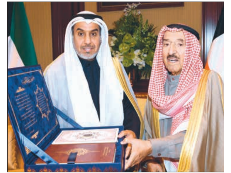
صاحب السمو الأمير الشيخ صباح الأحمد يتسلم المصحف الشريف من فهد الشعلة

الشيخ نواف الأحمد بقصر بيان صباح أمس وزير الأوقاف والشؤون الإسلامية وزير الدولة لشؤون البلدية فهد الشعلة حيث أهدى سموه نسخة مطبوعة من المصحف الشريف.