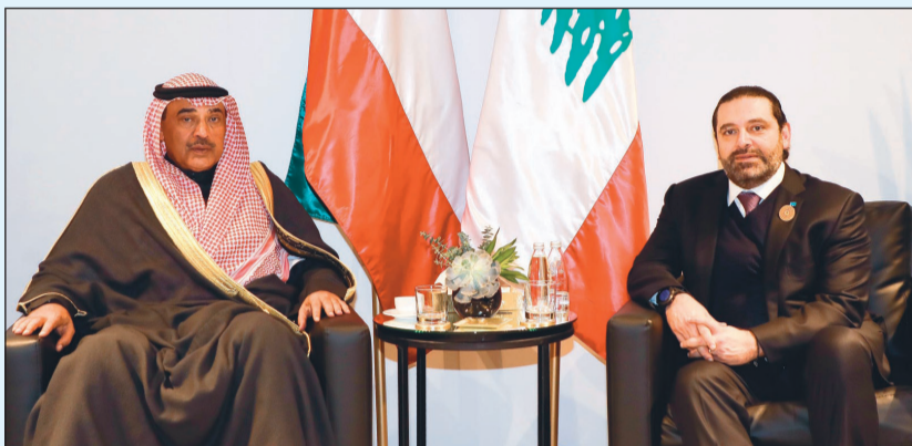
ممثل صاحب السمو الأمير الشيخ صباح الأحمد الشيخ صباح الخالد خلال اللقاء مع رئيس الحكومة اللبنانية المكلف سعد الحريري