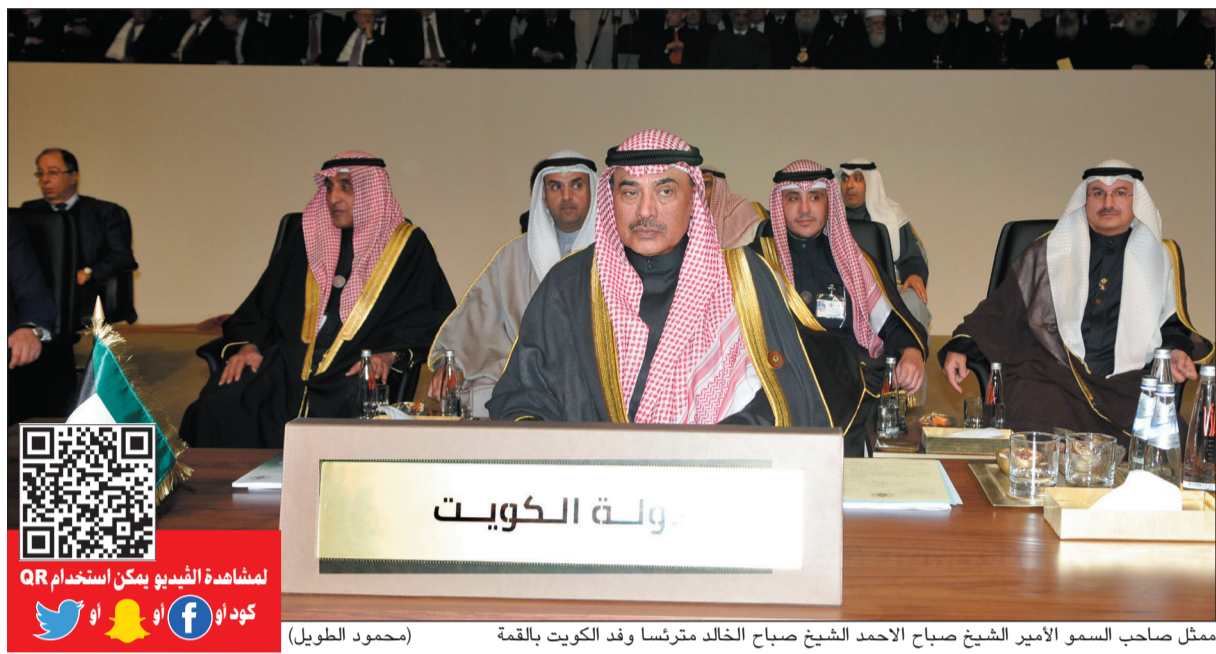
ممثل صاحب السمو الأمير الشيخ صباح الأحمد الشيخ صباح الخالد مترشسا وفد الكويت بالقمة

بيروت - كونا: حضر ممثل صاحب السمو الأمير الشيخ صباح الأحمد نائب رئيس مجلس الوزراء ووزير الخارجية الشيخ صباح الخالد مائدة غداء أقامها الرئيس العماد ميشال عون رئيس الجمهورية اللبنانية الشقيقة وذلك على شرف رؤساء الوفود المشاركة في القمة العربية التنموية الاقتصادية والاجتماعية وذلك بقاعة قمة المؤتمر بالعاصمة بيروت. كما التقى ممثل صاحب السمو الأمير أسد في لقاءات منفصلة كلا من رئيس الحكومة اللبنانية المكلف سعد الدين الحريري، ووزير الخارجية وشؤون المغتربين بالملكة الأردنية الهاشمية الشقيقة امين الصفدي والوفد العراقي، وكذلك وزير الخارجية بجمهورية الصومال الفيدرالية الشقيقة احمد عيسى عوض والوفد العراقي، وذلك في قاعة قمة المؤتمر بالعاصمة بيروت.