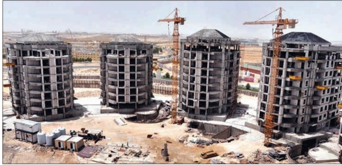
مشروع دبي لاجون بعد توقفه