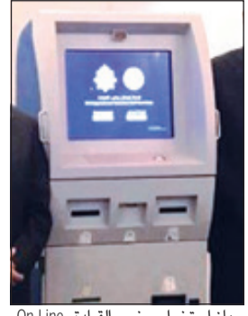
جهاز استخراج رخص القيادة «On Line»

أعلن مصدر أمني أن قطاع المرور انتهى من وضع أجهزة متقدمة لتسليم رخص القيادة إلكترونياً في إدارات المرور الـ 6 بهدف إصدار أو تجديد الرخص «On Line»، وكذلك تم إلحاق عدد من الموظفين بدورات تدريبية لاستقبال المعاملات إلكترونياً وإيجازها. وأوضح المصدر أنه في غضون شهرين سيتم استقبال معاملات المواطنين فقط لتجديد