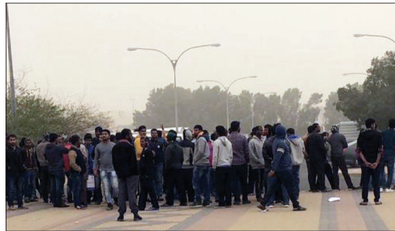
البنغاليون متجمعون أمام سفارة بلادهم

أكد مصدر أمني مطلع ان «الداخلية» لم تتخذ حتى الآن اي اجراء بحق أكثر من 200 بنغالي تجمروا في مقر سفارة بلدهم بعد ان اقتحموها وحطموا بعض مكاتبها، مشيراً الى ان الوزارة قد تصد قراراً بإبعادهم ادارياً عقب تسوية مستحقاتهم المالية وحصولهم عليها كاملة. وقال المصدر في تصريح لـ «الانباء»: ان هناك قضية قدمتها السفارة بحق رعاياها، اتهمتهم فيها بالتهجم على المبنى واتلاف مال الغير، لكنهم - حسب التحقيقات - لهم مستحقات مالية، ومن السابق لاولانه اتخاذ قرار بإبعادهم قبل حسم هذه القضايا. وأشار المصدر الى انه تتم حالياً دراسة ايجاد آلية لنصرف المستحقات المالية لهؤلاء العمال والحصول على تنازل من السفارة عن القضية، وعندما سيتم رفع كتاب الى وكيل وزارة الداخلية الفريق عصام النهام بشأن اتخاذ ما يلزم من اجراءات لإبعادهم مع ادراج اسمائهم على قوائم غير المصرح لهم بدخول الكويت مرة أخرى.