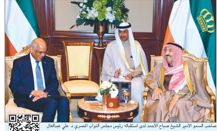
صاحب السمو الأمير الشيخ صباح الأحمد لدى استقباله رئيس مجلس النواب المصري د. علي عبدالعال

وقالت المصادر ان ميزانية الرواتب وما في حكمها ستزيد ولن تنخفض لأنه لم تتم الإصلاحات المقدمة من الحكومة حتى الآن. وأملت المصادر إلى أن نسبة الزيادة في حدود 3٪ تقريباً وستكون من 200 إلى 300 مليون دينار. وبذلك فمن المتوقع أن تصل ميزانية الرواتب إلى 11 ملياراً و500 مليون دينار تقريباً، بعد ان بلغت في ميزانية العام المالي الماضي 11 ملياراً و230 مليون دينار. أي تفوق ما نسبته 55٪ من المصروفات المتوقعة. وردا على سؤال حول ميزانية الدعم، أكدت المصادر انها في حدود 3 مليارات ونصف المليار دينار، وبشأن سقف المصروفات، ردت المصادر قائلة: وضعتنا سقفاً أعلى للمصروفات لثلاث سنوات متتالية، وحدد سقف مصروفات العام المالي الماضي 2019/2018 والعام المالي الجديد 2020/2019 بـ 20 مليار دينار. إلا ان الاحتياجات المالية لم تمكن من الالتزام به ورفع السقف إلى 21 ملياراً و500 مليون دينار في ميزانية 2019/2018.