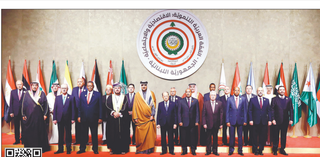
رؤساء وزعماء وممثلو الدول العربية المشاركة في القمة الاقتصادية في بيروت أمس

يمكن استخدام QR كود أو لمشاهدة الفيديو أو يمكن استخدام QR كود أو