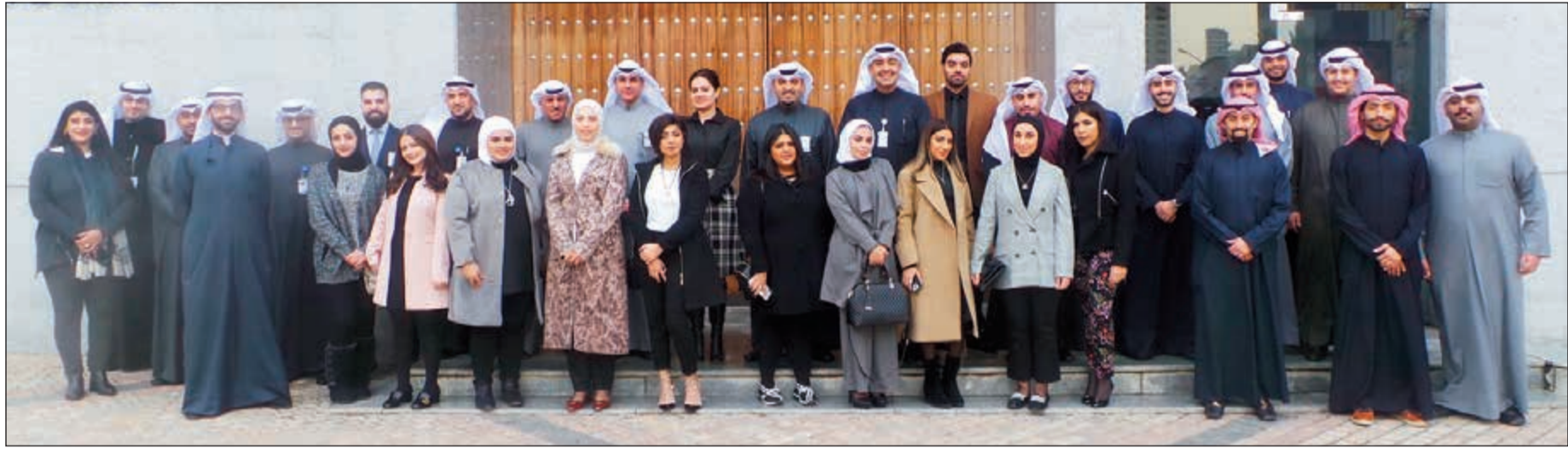
صورة جماعية لمتدربي برنامج «يلا وطني»

من جهة وتحقيق طموحات الموظفين من جهة أخرى. ويأتي برنامج «يلا وطني» ضمن البرامج التدريبية التي يطلقها البنك سنويا بهدف استقطاب الكفاءات الوطنية الشابة، حيث تم إعداد البرنامج ليناسب مع حاجة سوق العمل، وذلك من خلال تقديمه فرصا تدريبية للخريجين الجدد المميزين، والذين اجتازوا الاختبارات المؤهلة للبرنامج. ويعد «يلا وطني» برنامجا تأهليا حديثا التخرج من الكوادر الوطنية لتدريبهم بشكل احترافي على مختلف جوانب العمل المصرفي، ويعتمد البرنامج على أسلوب التدريب العملي والنظري، كما يسهم البرنامج أيضا في صقل وتطوير المهارات الشخصية للمتدربين، ويساعدهم على تطوير الذات بشكل سريع، حيث تم تصميم البرنامج بشكل متوازن ليكون له فاعلية كبيرة في تأهيل هؤلاء الشباب للانخراط في الحياة العملية.