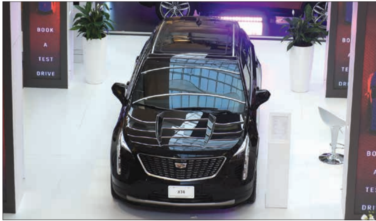
كاديلاك XT4 الجديدة كلياً